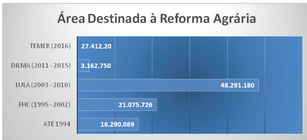
Gráfico 2: Área destinada à Reforma Agrária