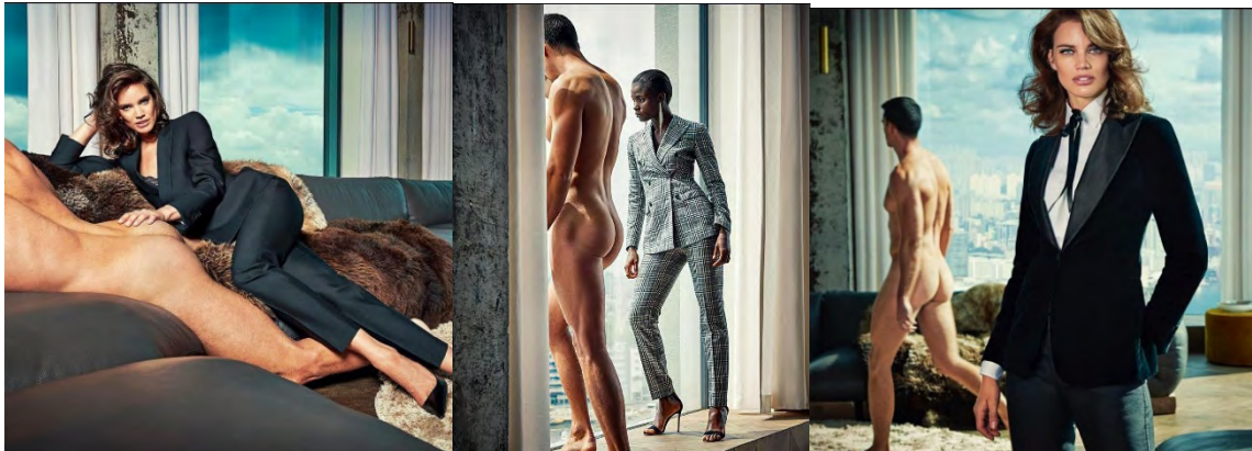
Figura 07 – Primeira campanha Suistudio .