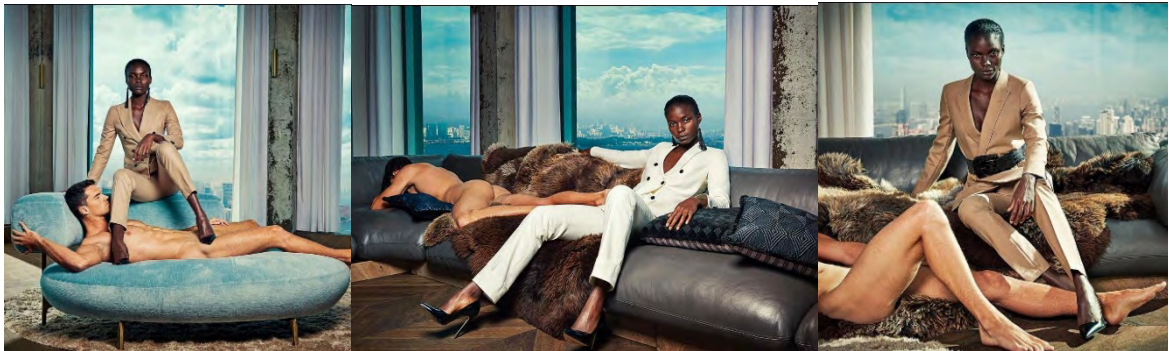
Figura 06 - Primeira campanha Suistudio.

A empresa Suistudio , marca holandesa que se lançou no mercado da moda em agosto de 2017 utilizou como estratégia de ingresso no ramo da alfaiataria feminina a inversão de papéis em suas campanhas publicitárias, os corpos nus não são mais femininos e sim masculinos.