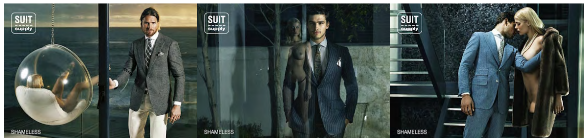
Figura 05 - Campanha Shameless.

Inicialmente, é possível inferir que o ideal de força masculina pela alfaiataria não é apenas demonstrado pelas cores e formas anguladas do terno, mas pelo cenário que nos é apresentado. Nas imagens selecionadas para comporem a quarta figura, percebemos a submissão da mulher perante o homem perfeitamente alinhado com seu terno Suitsupply , as posições femininas são trazidas para reforçar a ideia de servidão do corpo feminino ao prazer e desejo masculino, importante destacar também como o vestuário feminino baseado apenas em vestidos acaba por se tornar meio mais fácil de acesso à sua genitália e erotização dos corpos.