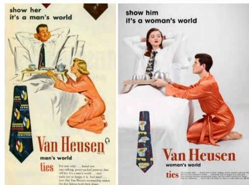
Figura 02 – Publicidade gravatas Van Heusen