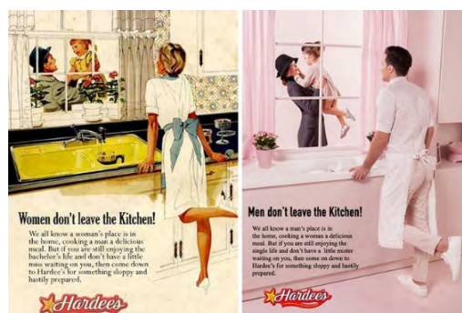
Figura 03 – Publicidade Hardee's empresa de fast-foods.

Na segunda imagem temos uma campanha de uma marca americana de gravatas em que o homem está sendo servido na cama por sua esposa que se encontra ajoelhada ao seu lado de roupão, enquanto ele veste uma camisa branca e uma gravata Van Heusen. Como slogan original a frase show her it's a man's world 5 . Ao lado a nova perspectiva invertida, demonstrando a submissão do homem perante a mulher e o slogan : show him it's a Woman's world 6 .