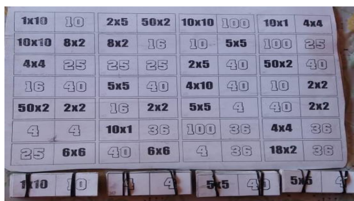
Figura 1 – Dominó da Multiplicação completo

A Figura 1 ilustra um possível modelo para o Dominó da Multiplicação 1 , incluindo peças com diferentes combinações entre multiplicações e produtos.