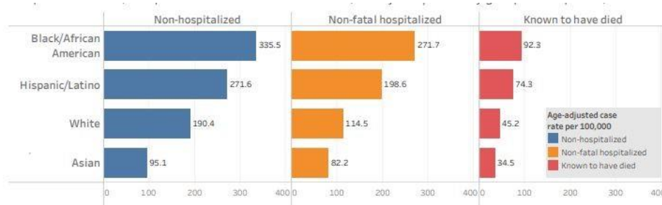
Figura 4: Contaminados, curados e mortos pelo COVID-19 por origem racial

Fonte: https://www1.nyc.gov/assets/doh/downloads/pdf/imm/covid-19-deaths-race-ethnicity-04162020-1.pdf . Acesso em 20 de abril de 2020