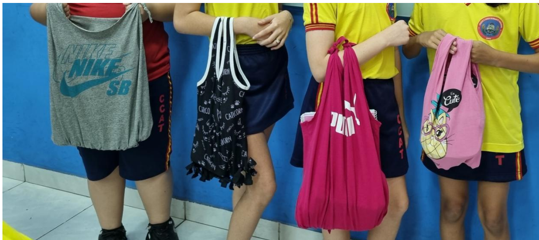
Figura 4. Confeção de ecobags.

4ª Etapa: Avaliar os conhecimentos adquiridos pelos alunos. Para isso, aplicamos uma sequência de questões interativas que compararam os conhecimentos prévios dos alunos, evidenciados na primeira aula, com os conhecimentos adquiridos ao longo da proposta e demonstrados na última aula. Essa abordagem permitiu verificar a evolução didática em relação ao conteúdo ministrado.