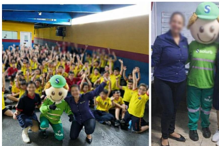
Figura 2. Atividades pedagógicas para aprendizagem sustentável.

2ª Etapa: Palestra intitulada "Reciclando Nossas Atitudes", promovida pela empresa SOLURB 3 Soluções Ambientais (Figura 2). Esta atividade, também com duração de 50 minutos, ocorreu no pátio do colégio e abordou temas como a destinação correta de resíduos sólidos, coleta seletiva e os benefícios da reciclagem. A palestra destacou a importância da destinação adequada de resíduos, como aterros sanitários e usinas de triagem, além do impacto do lixo na degradação ambiental. Foi um momento enriquecedor que enfatizou a construção de um futuro mais sustentável.