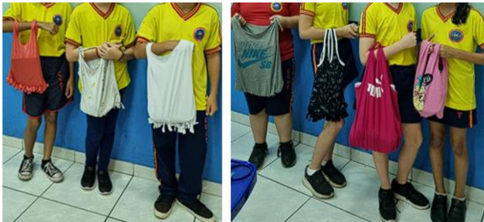
Figura 3. Confeção de ecobags.