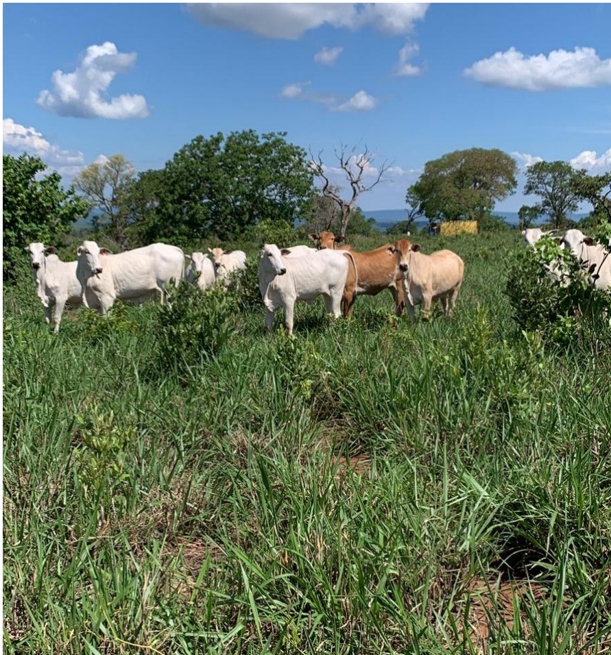
Figura 7. Conferência do capim e dos animais à campo.

Após o levantamento, a equipe formulou algumas opções para repassar ao responsável da fazenda, dentre elas, realizar algumas mudanças de lotes, assim como quais áreas necessitariam de maior atenção de início.