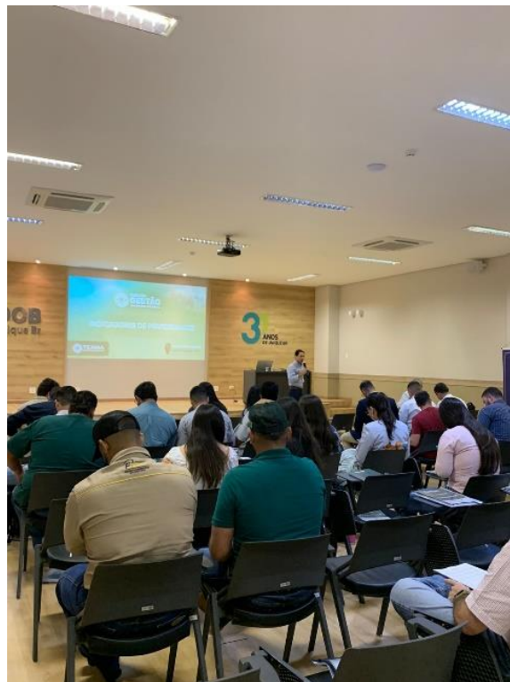
Figura 5. Curso de Gestão de Empresas Pecuárias.

Todavia, a empresa não é focada apenas no controle de dados das propriedades. Em empresas recém “iniciadas” recebem o acompanhamento presencial, onde, são realizados manejos na propriedade, além do levantamento dos processos da fazenda.