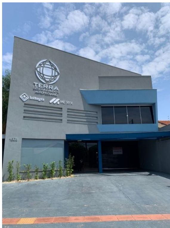
Figura 1. Sede da Terra Desenvolvimento Agropecuário na cidade de Campo Grande/MS.

Além dos programas citados anteriormente, o Instituto Inttegra possui uma plataforma onde são ministradas “aulas” específicas sobre diferentes tópicos (Figura 2), objetivando realizar a capacitação tanto dos colaboradores, quanto dos produtores que adquirem o pacote de serviços da empresa.