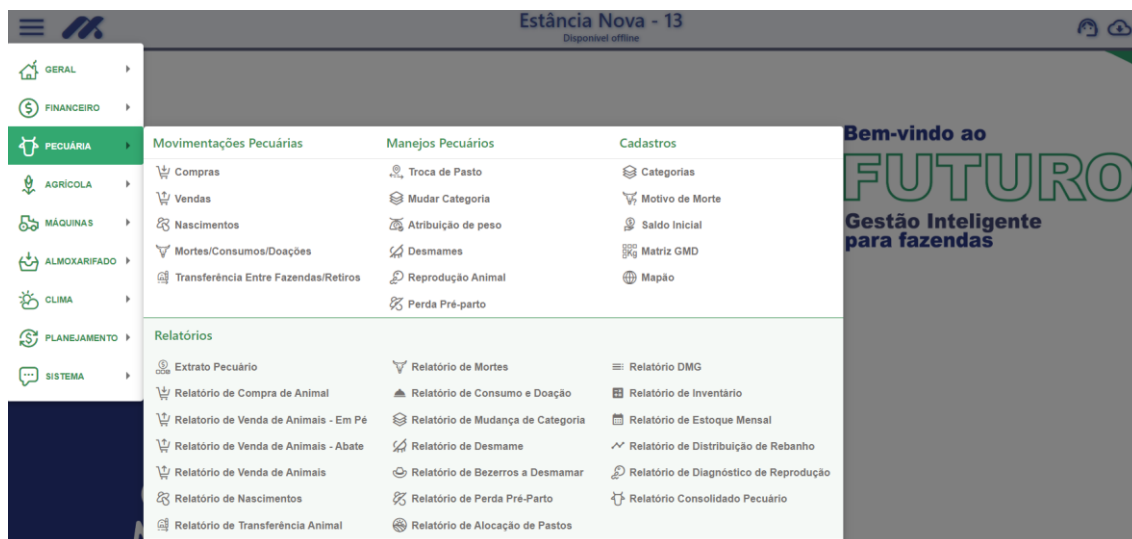
Figura 3. Demonstração de módulo pecuária no sistema Metryx.

Ressalta-se também que no software é possível realizar o lançamento do controle de máquinas, movimentação de implementos e abastecimentos. Essa abordagem permite aos produtores realizarem um controle total sobre as operações da fazenda.