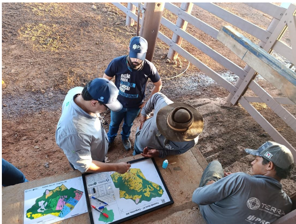
Figura 8. Elaboração do Mapa e Troca de Informações com o Responsável.

O compartilhamento de informações proporcionado pelos extensionistas é peça chave para os produtores. Um dos principais objetivos das ações de extensão é promover o alavancamento da produção agropecuária de forma assertiva, econômica e sustentável (DE FARIAS; DE OLIVEIRA & SOARES, 2022).