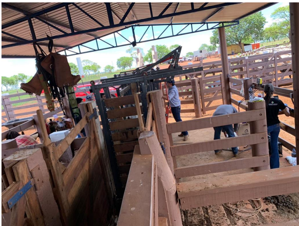
Figura 6. Manejos realizados na propriedade em Corguinho/MS.

Essa “brincagem” foi realizada através dos botons eletrônicos onde, o intuito é realizar o registro individual de cada animal, após colocar os brincos, realizou-se o teste no sistema Metryx, onde, em uma das abas, é possível realizar o controle individual dos animais.