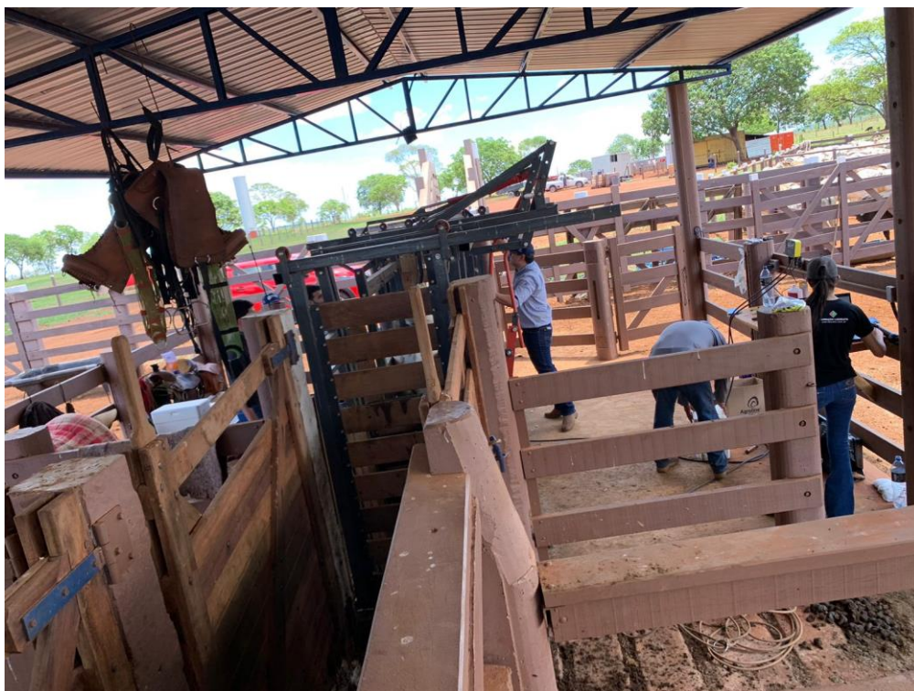
Figura 6. Manejos realizados na propriedade em Corguinho/MS.

Essa “brincagem” foi realizada através dos botões eletrônicos onde, o intuito é realizar o registro individual de cada animal, após colocar os brincos, realizou-se o teste no sistema Metryx, onde, em uma das abas, é possível realizar o controle individual dos animais.