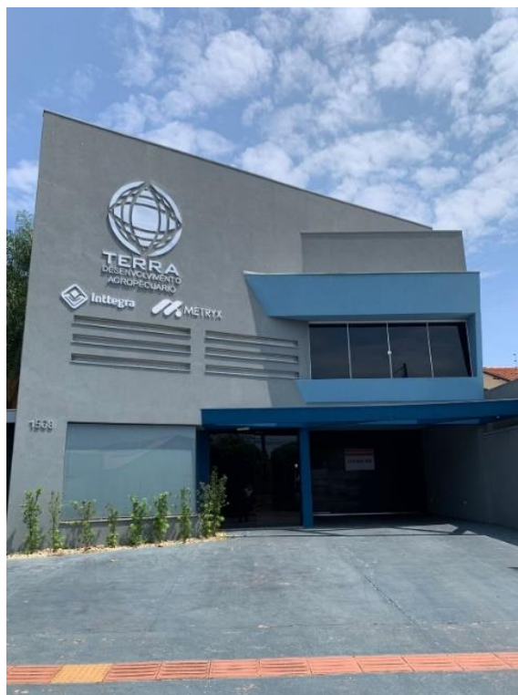
Figura 1. Sede da Terra Desenvolvimento Agropecuario na cidade de Campo Grande/MS.

Além dos programas citados anteriormente, o Instituto Inttegra possui uma plataforma onde são ministradas “aulas” específicas sobre diferentes tópicos (Figura 2), objetivando realizar a capacitação tanto dos colaboradores, quanto dos produtores que adquirem o pacote de serviços da empresa.