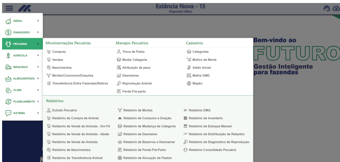
Figura 3. Demonstração de módulo pecuária no sistema Metryx.

Ressalta-se também que no software é possível realizar o lançamento do controle de máquinas, movimentação de implementos e abastecimentos. Essa abordagem permite aos produtores realizarem um controle total sobre as operações da fazenda.