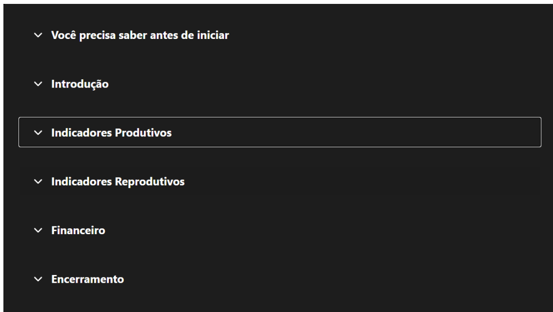
Figura 2. Aulas abordadas durante o curso Fazenda em Números.