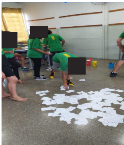
Figura 2 – Cartões espalhados pela sala de aula

Para o início da atividade, foram espalhados pela turma (Fig. 2) cartões contendo nomes de tipos de lixo (Fig. 3), por exemplo, “caixa de leite”, “latinha de refrigerante”, “sacola plástica”, entre outros. Cada grupo decidiu um membro para correr em direção das cartas e colocar as mesmas em lixeiras com as cores respectivas da coleta seletiva, feitas através de material reciclagem pelos próprios graduandos (Fig.4) no tempo de 3 minutos, no final foram contabilizados os erros e acertos de cada grupo, todos os alunos foram premiados por participação, mas o grupo vencedor ganhou um brinde extra.