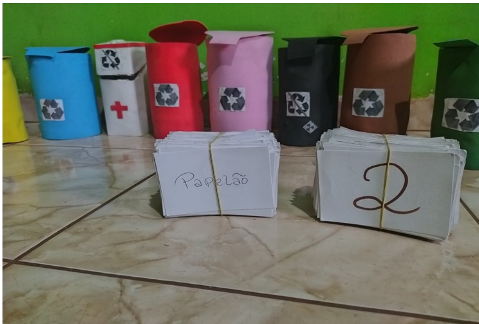
Figura 5 – material confeccionado