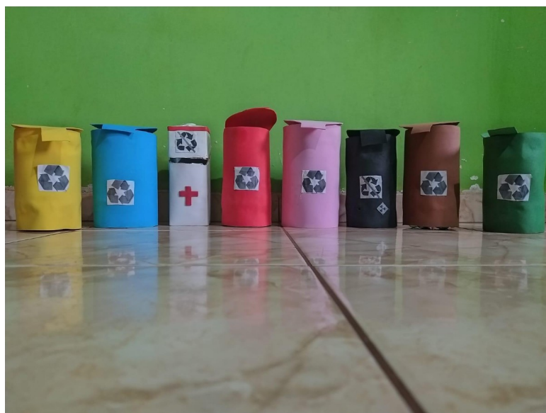
Figura 4 – Lixeiras desenvolvidas com material reciclável