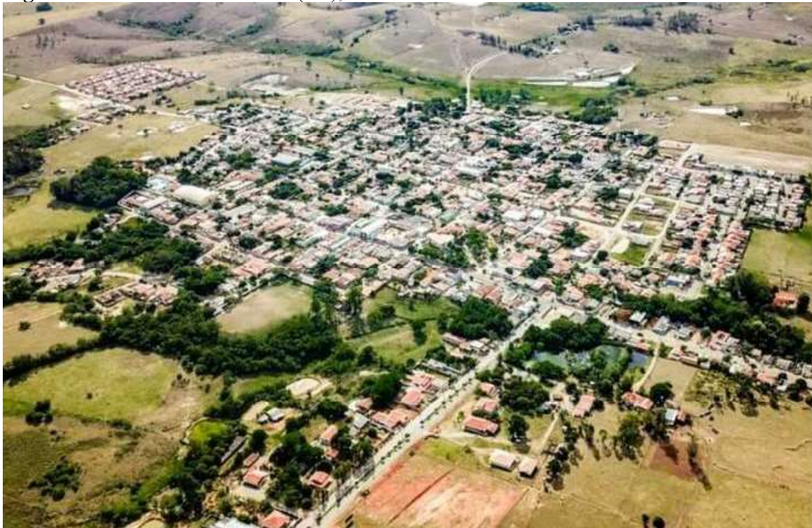
Figura 2. Conselheiro Mairinck (PR), 2019