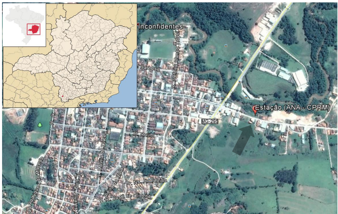
Figura 1 - Localização da estação pluviométrica..

Foram analisados no trabalho os dados coletados na estação pluviométrica instalada no município de Inconfidentes-MG nas margens do rio Mogi-Guaçu. Esta estação é mantida pela Agência Nacional de Águas (ANA) e operada pela Companhia de Pesquisa de Recursos Minerais (CPRM). Os dados utilizados estão disponíveis no site Hidroweb ( http://www.snirh.gov.br/hidroweb/ ) e a estação localizada nas coordenadas geográficas com latitude 22°19'07.1"S e longitude 46°19'17.9"W (Figura 1).