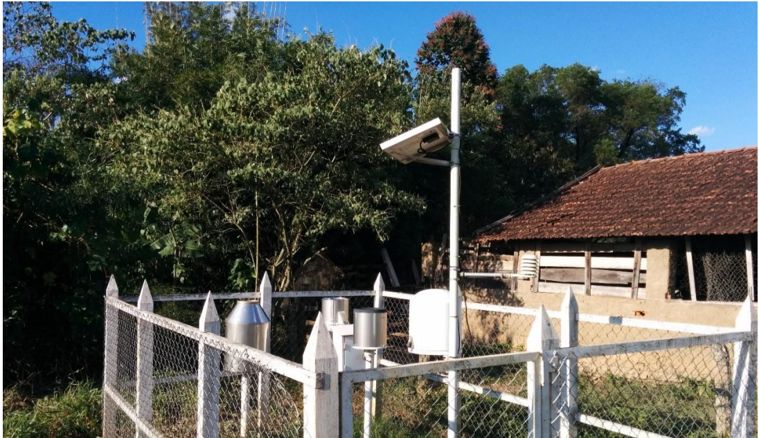
Figura 2 - Vista geral da estação pluviométrica.

Os dados obtidos foram de 1967 a 2015, sendo desconsiderados os anos de 1972, 1991, 1992, 2006 e 2007 por falta de consistência; os 44 anos restantes foram analisados e deixados em conformidades (preenchimento de falhas e ordenação), proporcionando uma série histórica consistente. Com esses dados foi possível obter informações como, máxima diária, média de precipitação mensal e anual e mínima/máxima mensal; que possibilitou a geração dos gráficos.