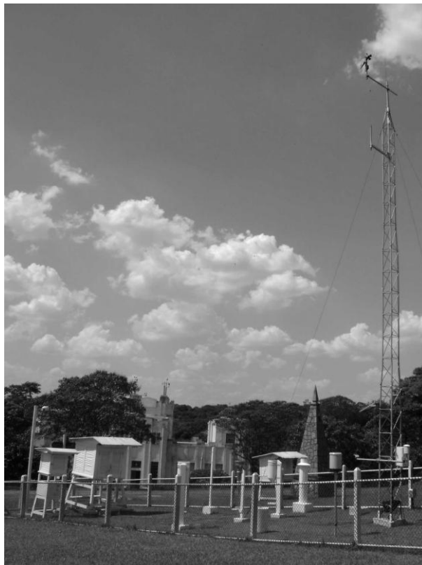
Figura 01 : Cercado da Estação Meteorológica do ,IAG USP e da Estação Meteorológica do Laboratório de Hidrometeorologia

As coordenadas geográficas das estações são: Latitude = 23^{\circ} 39' 03'',96 S (EC) e 23^{\circ} 39' 04'',22 S (EMA) Longitude = 46^{\circ} 37' 21'' W (ambas) Altitude = 802,0 m (ambas).