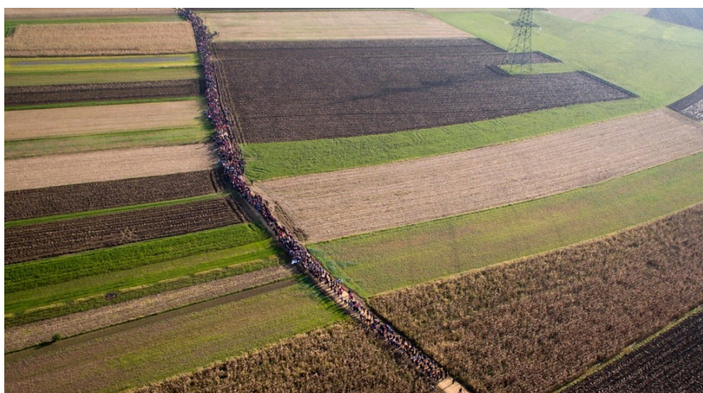
Figura 3 - Coluna de migrantes atravessando campo de plantações na Eslovênia.

Disponível em: https://edition.cnn.com/2015/09/03/world/gallery/europes-refugee-crisis/index.html . Acesso em 30 de outubro de 2018.