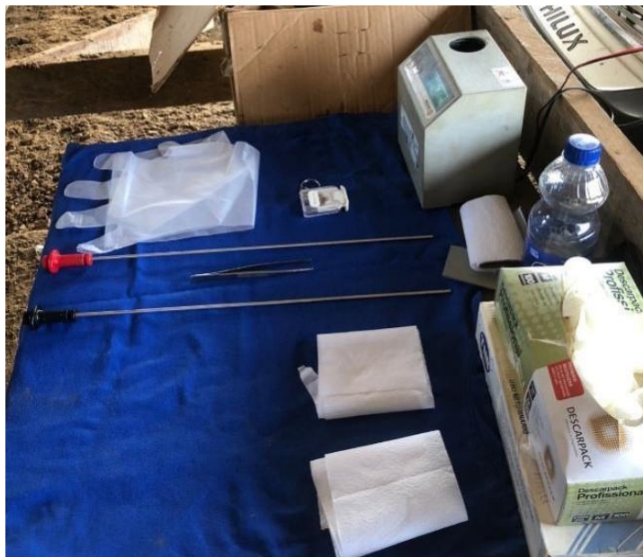
Figura 4. Equipamentos necessários para realização da inseminação artificial.

Após aquisição dos materiais e equipamentos, necessários para realização da IA, realizou-se a preparação e oferta de cursos de IA na propriedade. Em relação a divulgação do curso de inseminação artificial participou como apoio logístico discentes do curso de Zootecnia, AGRAER e sindicato rural.