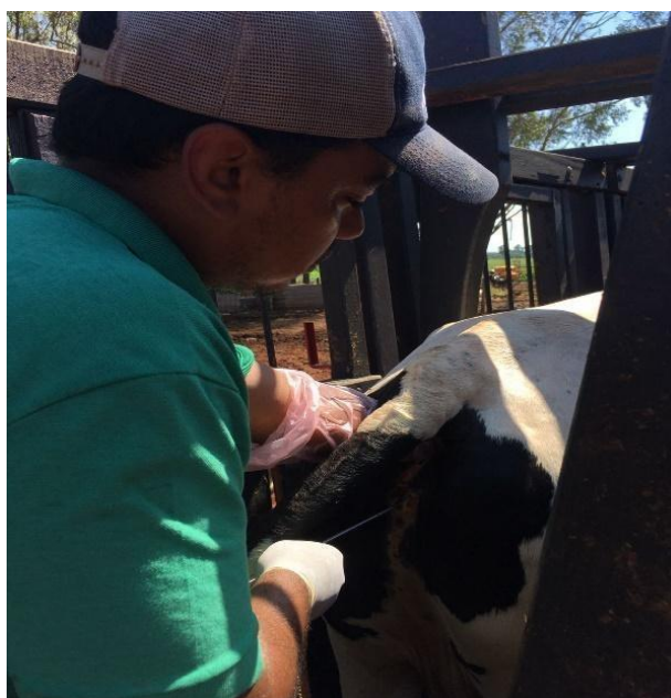
Figure 6. Discente na prática da inseminação artificial.

Além do enfoque descrito no parágrafo anterior, enfatiza a relação da igualdade social e disseminação de tecnologias que buscam melhorar a vida da população, gerando igualdade social e poder contribuir para o bem-estar coletivo. Nesse sentido, reforça em que a utilização de ações de extensão, que possibilitem os acadêmicos colocarem em prática os conhecimentos teóricos adquiridos em sala de aula, permita que os mesmos conheçam e executem novas tecnologias, como a inseminação artificial, para que possam ser utilizadas em locais que por falta de acesso a tais tecnologias não conta com esse tipo de informação (SILVA et al., 2019).