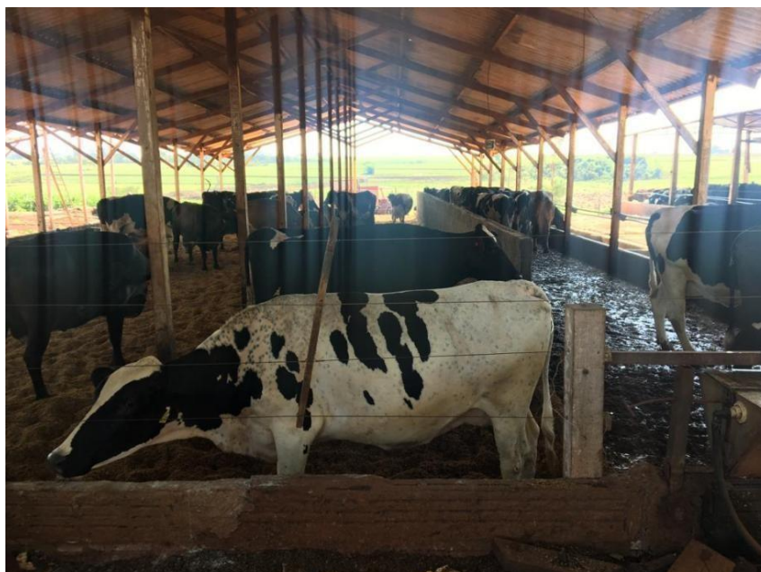
Figure 2. Galpão de confinamento das vacas em lactação no sistema de Compost de Barn .

Para a implantação da IA na propriedade e realização do curso o produtor sob orientação de docentes da Universidade, comprou os equipamentos necessários para realização da IA: botijão com nitrogênio líquido (Figura 3), sêmen, luvas de palpação, bainhas descartáveis de inseminação, aplicador universal de sêmen, termômetro, tesoura ou cortador de palhetas, pinça, ebulidor e caixa de isopor, papel toalha ou papel higiênico (Figura 4).