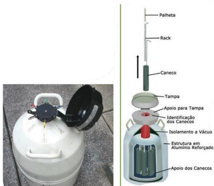
Figura 3. Botijão de sêmen.

Para a implantação da IA na propriedade e realização do curso o produtor sob orientação de docentes da Universidade, comprou os equipamentos necessários para realização da IA: botijão com nitrogênio líquido (Figura 3), sêmen, luvas de palpação, bainhas descartáveis de inseminação, aplicador universal de sêmen, termômetro, tesoura ou cortador de palhetas, pinça, ebulidor e caixa de isopor, papel toalha ou papel higiênico (Figura 4).