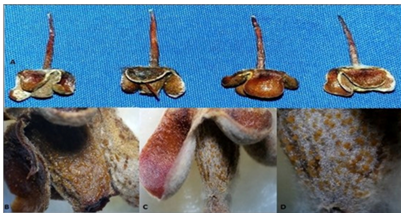
Figura 2. Incidência de Colletotrichum spp. em flores de goiabeira-serrana em estágio H de fenologia floral. A: Infecção de Colletotrichum spp. em sépalas e estilete de flores. B/C/D: Incidência de Colletotrichum spp. em frutos, no detalhe os pontos alaranjados são acérvulos de Colletotrichum spp.. Barra = 0,5 cm.

Flores nestas condições, possivelmente não produzirão frutos, ou mesmo que haja produção, os mesmos não serão saudáveis. Os mesmos sintomas presentes nas flores apresentadas na Figura 2 foram descritos por Blood et al. (2015), que confirmaram a infecção de Colletotrichum spp. em flores de caquizeiro das cvs. “Fuyu” e “Kakimel” através da esporulação em ovários e na base das sépalas.