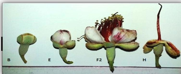
Figura 1. Estágios fenológicos de florescimento de goiabeira-serrana. B: Botão floral fechado, E: Desabrochar das peças florais, F 2 : Flor completa após antese, H: Flor com estilete já com pétalas caídas. Barra = 0,5 cm.

Em cada pomar das estações experimentais da EPAGRI dos municípios de Lages/SC e São Joaquim/SC, foram selecionadas aleatoriamente 10 goiabeiras-serrana de cada cv.: “Alcântara”, “Helena”, “Mattos” e “Nonante” onde foram coletadas 100 flores sem sintomas aparentes de antracnose nos estágios fenológicos de florescimento B, E, F 2 e H (Ducroquet & Hickel, 1991) (Figura 1).