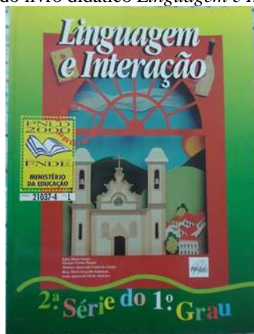
Figura 2: Capa do livro didático Linguagem e Interação , de 1996