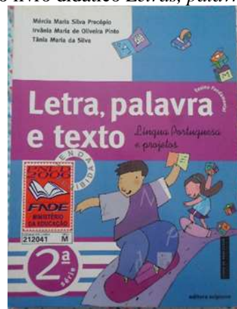
Figura 4: Capa do livro didático Letras, palavras e texto , de 2001.