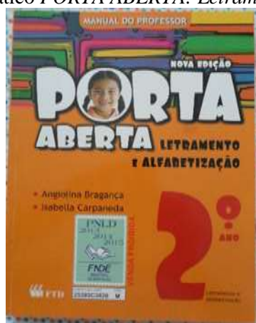
Figura 7: Capa do livro didático PORTA ABERTA: Letramento e alfabetização , de 2011.