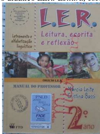
Figura 6: Capa do livro didático LER: Leitura, escrita e reflexão , de 2008.