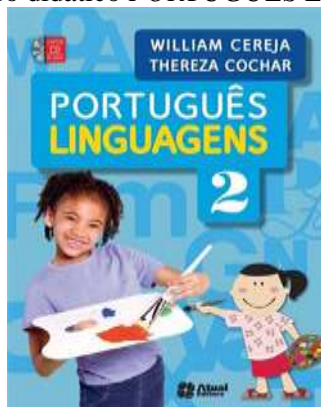
Figura 7: Capa do livro didático PORTUGUÊS LINGUAGENS , de 2016.