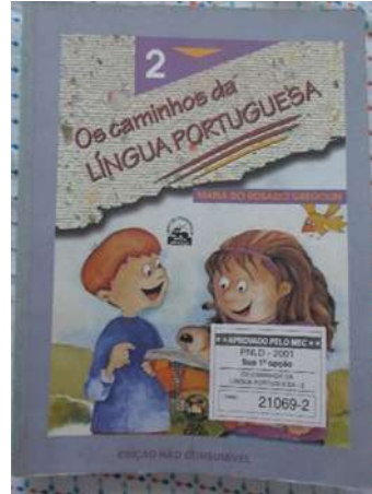
Figura 3: Capa do livro didático Os caminhos da Língua Portuguesa , de 2000.