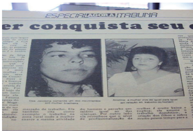
Figura 2 - Colocar título