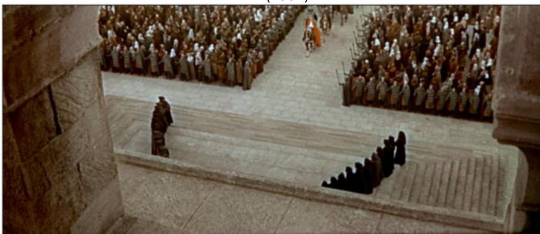
Imagem 1: Canterbury via shepperton: Henrique chega para fazer sua penitência (1964)