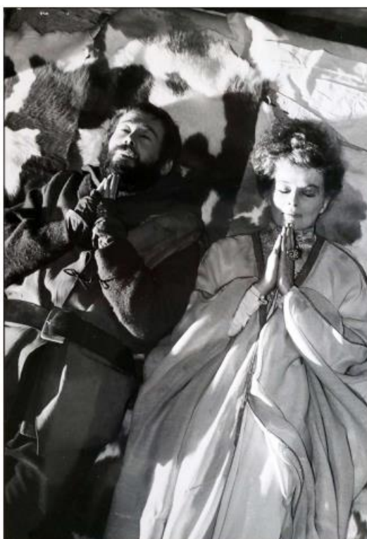
Imagem 3. O’Toole e Hepburn, fotografia de divulgação, sem data.

As fotografias promocionais dos filmes, que apresentam a efigie da tumba de Fontevraud e sua emulação por Katharine Hepburn e Peter O’Toole, colaboram para a construção de uma imagem dos reinados representados como — senão eternos — ao menos passíveis de uma ressurreição cíclica (Imagem 3).