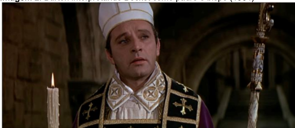
Imagem 2: Burton interpretando Becket como padre e bispo (1964)