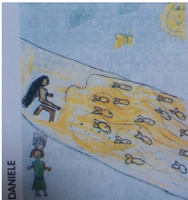
Imagem 2 – Representação do conto A mãe D'água