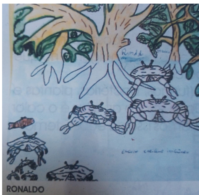
Imagem 1 – O manguezal