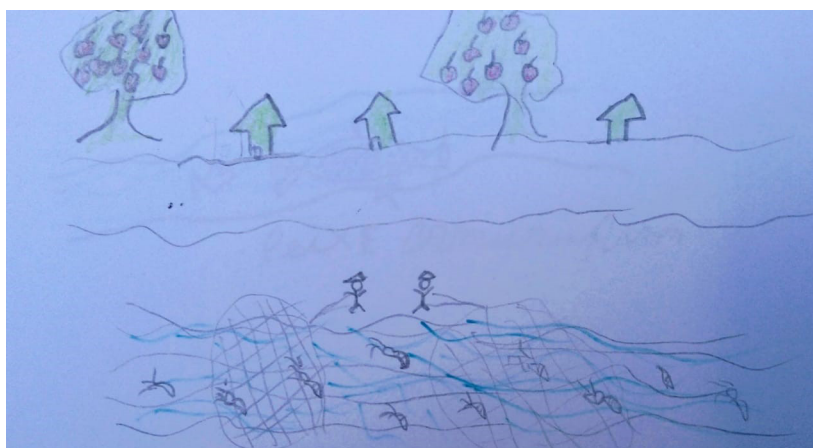
Imagem 4 – O meio ambiente e a pesca