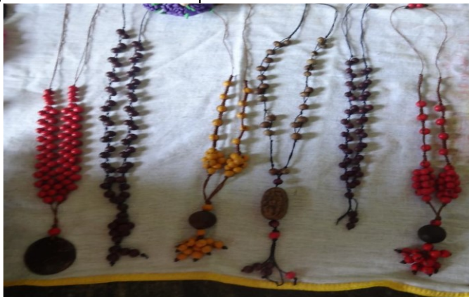
Fotografia 2 – Colares feitos por mulheres de Santa Rita de Barreira.