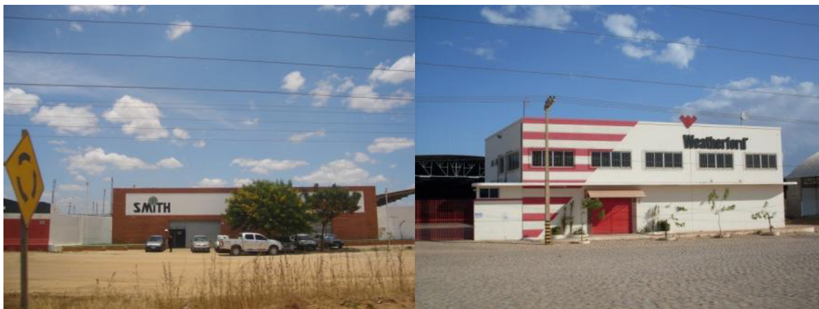
FIGURA 4 – Mossoró (RN). Empresas prestadoras de serviços para a Petrobras: Weatherford, à esquerda, e Smith, à direita.