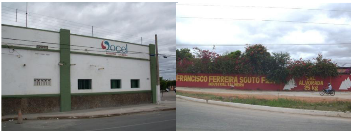
FIGURA 2 – Mossoró(RN). Indústrias Salineiras: Socel, localizada na área central de Mossoró, à esquerda, e Fco. Ferreira Souto Filho, localizada na BR-304, à direita.

Apesar de todo o processo de mecanização e monopolização das salinas, que provocou desemprego em massa e fechamento de várias empresas de pequeno e médio porte, a economia salineira ainda tem parcela de importância no mercado de trabalho mossoroense 5 , embora com participação consideravelmente menor do que a fruticultura e o petróleo. De acordo com o Siesal (2013), o setor salineiro emprega no Estado, diretamente, 3.842 pessoas, sendo que as seis principais empresas empregadoras (Salinor, Henrique Lage, F. Souto, Salina Diamante Branco, Cimsal e Norsal) possuem juntas um contingente superior a 2.200 postos de trabalho (SIESAL, 2013) 6 , o que dá uma dimensão da importância da região polarizada por Mossoró no que tange a esse setor.