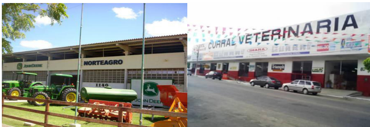
FIGURA 3 – Mossoró (RN). Loja de insumos agrícolas: Curral Veterinária, no Centro de Mossoró (esquerda) e Norteagro, na BR-304 (direita)