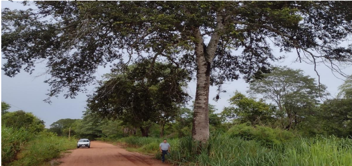
Figura 2 - Árvore - pé de jatobá