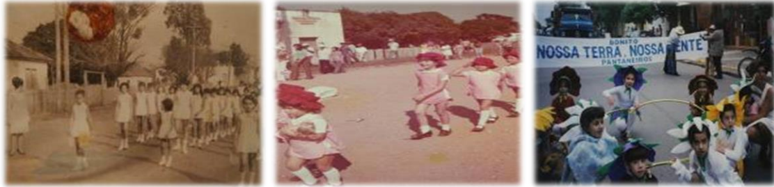
Figura 3 - Desfile cívico em Bonito, década de 70, 80 e 90.

Fonte: Revisitando as histórias do arquivo pessoal da entrevistada Juraci, relembro a importância das comemorações cívicas da cidade de Bonito para os seus moradores.