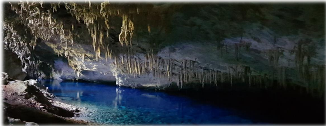
Figura 5: Gruta do Lago Azul

Fonte: Monumento Natural da Gruta do Lago Azul, tombada pelo IPHAN desde 1978. Foto: SILVESTRINI, R., 2018.