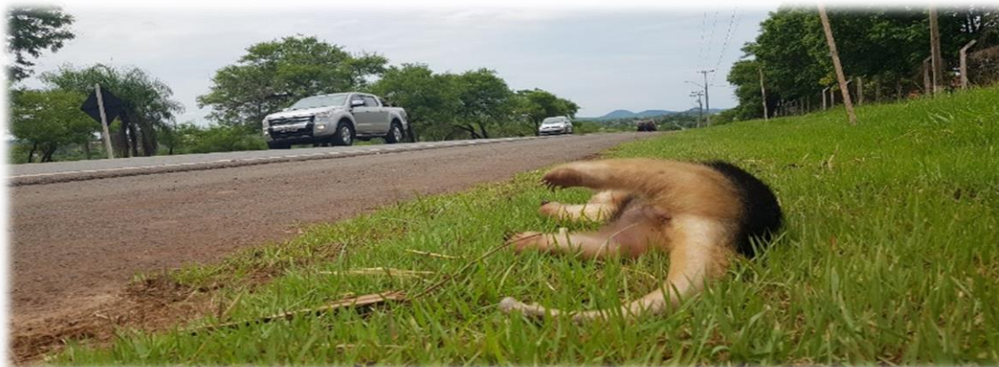
Figura 4 – Tamanduá morto na rodovia da entrada de Bonito que dá acesso ao Balneário Municipal

Fonte: Atropelamento de fauna em Bonito-MS. Foto: SILVESTRINI, R., 2019.