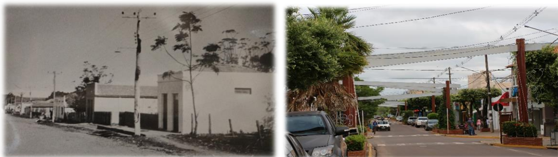
Figura 2 – Rua Pilad Rebuá em 1969 e 2019.