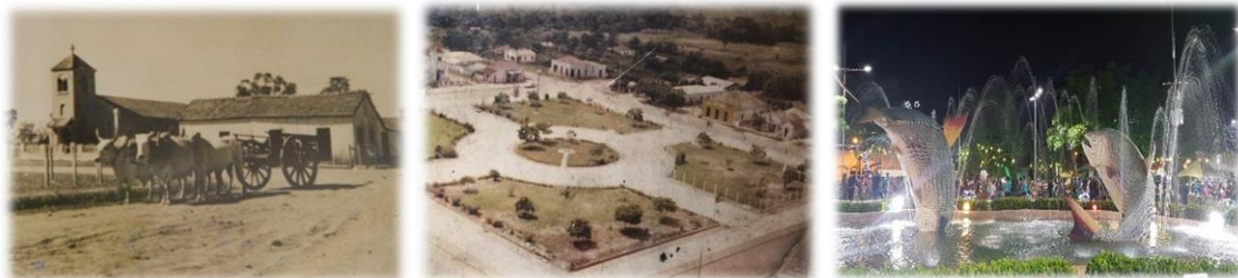
Figura 1 – Praça da Liberdade 1951, 1980 e 2019.