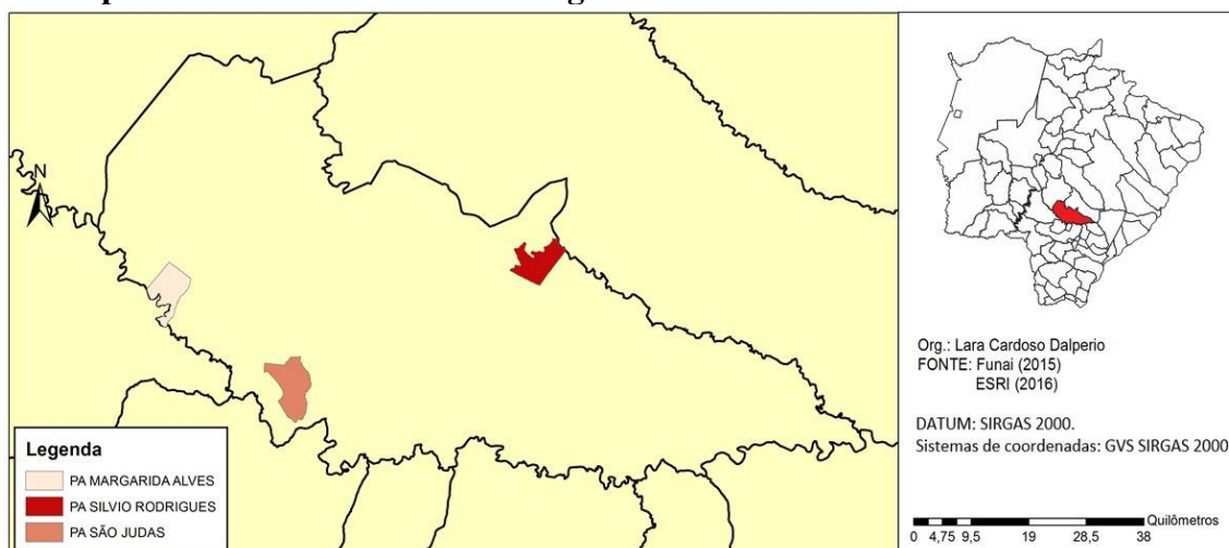
Mapa 1 - Assentamentos rurais originários da luta do MST em Rio Brilhante