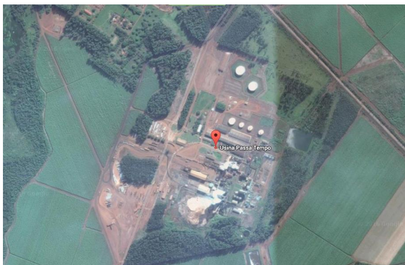
Figura 1: Foto aérea da unidade Passa Tempo em Rio Brilhante

A figura 1 apresenta a unidade Passa Tempo que, segundo da Bio-serv (2015), tem como números totais de processamento de cana-de-açúcar a capacidade de 3,3 milhões de toneladas de produção de etanol ( 66% - álcool anidro e hidratado) e de açúcar (49,7% - cristal), bem como do bagaço, a partir da produção energética que corresponde a 78 mw.