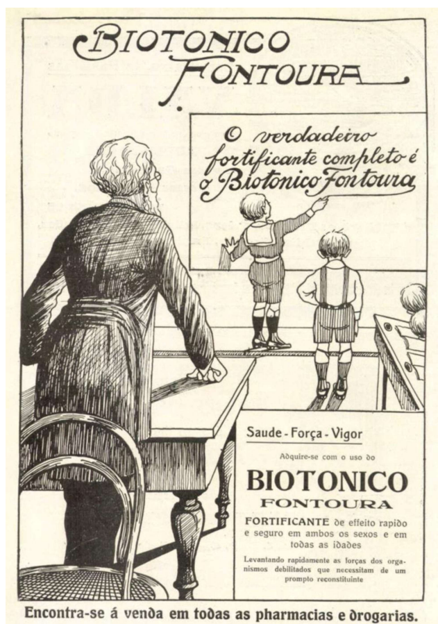
Figura 2: Revista A Cigarra, 1919, nº 122, p. 15.

Esse produto é apresentado como completo, o verdadeiro fortificante, podendo ser utilizado por indivíduos de ambos os sexos em todas as idades. Promete ainda o rápido restabelecimento dos organismos mais debilitados.