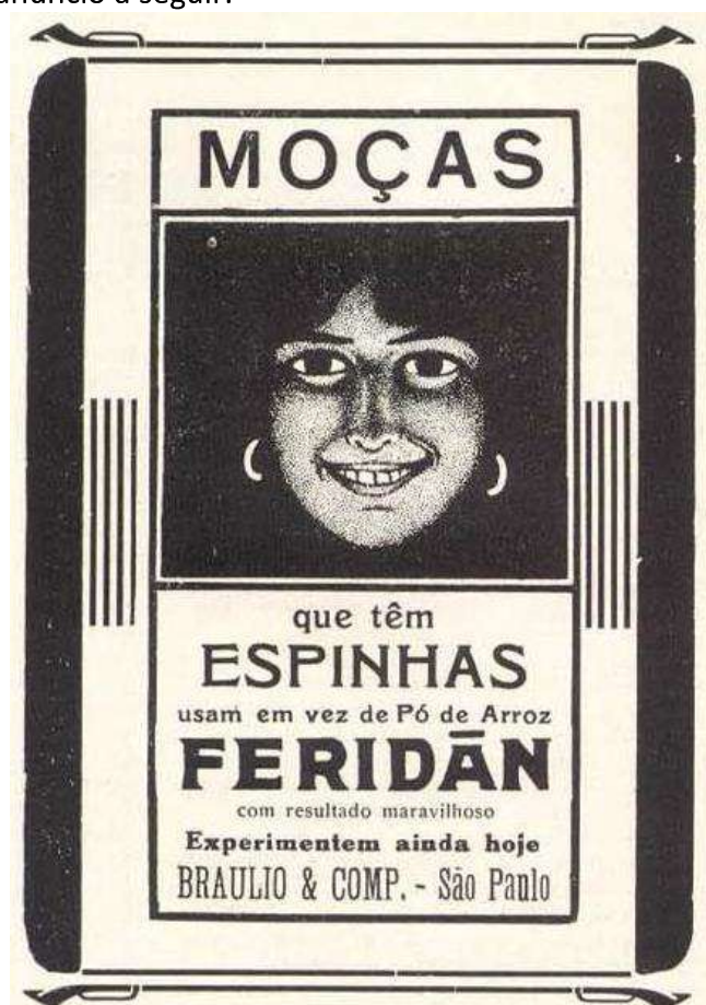
Figura 4: Revista A Cigarra, 1918, nº 83, p. 07.

Entre os diferentes medicamentos localizados na revista A Cigarra, cabe destacar a existência de alguns poucos produtos voltados especificamente para a adolescência. Como é o caso do anúncio a seguir.