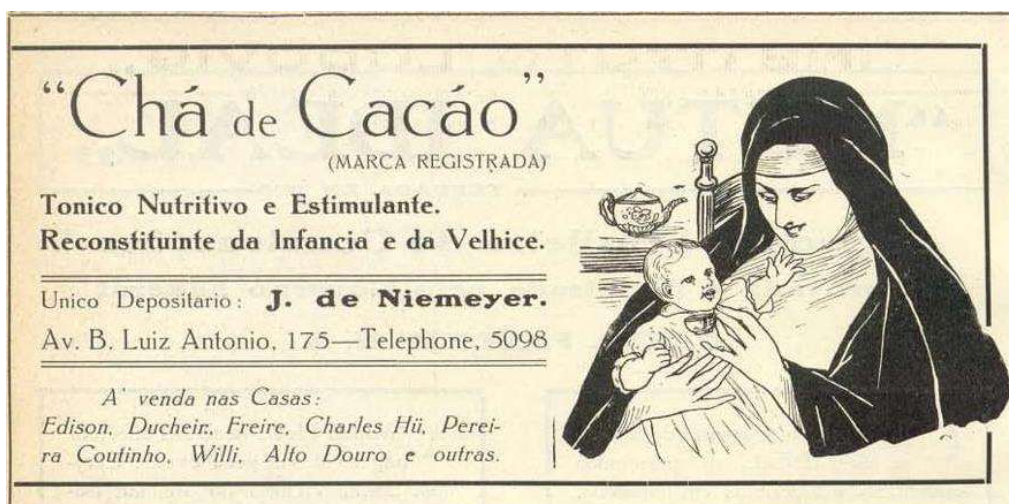
Figura 3: Revista A Cigarra, 1915, nº 31, p. 56.

Entre os diferentes medicamentos localizados na revista A Cigarra, cabe destacar a existência de alguns poucos produtos voltados especificamente para a adolescência. Como é o caso do anúncio a seguir.