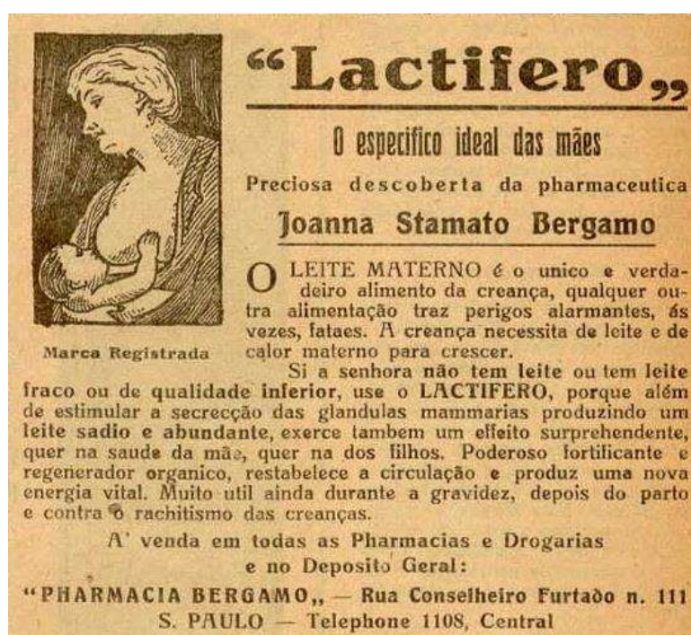
Figura 9: Revista A Cigarra, 1920, nº 140, p. 35.

Para sanar a dificuldade de amamentação das mulheres a indústria farmacêutica apresenta o medicamento Lactifero, como é possível observar na propaganda desse produto inserida a seguir.