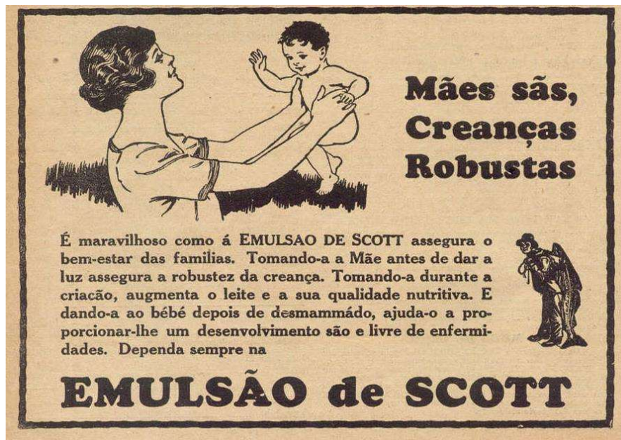
Figura 1: Revista A Cigarra, 1917, nº 300, p. 42.

A propaganda a seguir procura divulgar os benefícios do fortificante Emulsão de Scott.