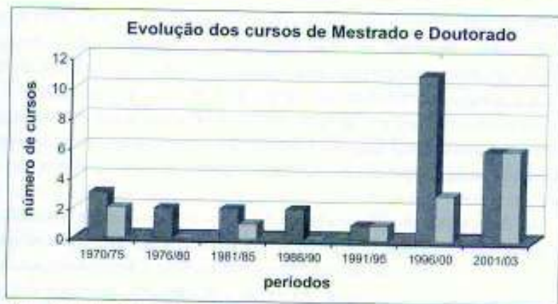
Figura 1: Evolução da criação de cursos de mestrado e doutorado em geografia.

Se, quantitativamente, têm-se conseguido, ano após ano, superar marcas e dinamizar a área de Geografia, quando a própria distribuição geográfica é considerada ainda se constata grande desigualdade. A ausência total, tanto de mestrado quanto de doutorado, na região Norte, é a face mais perversa desta desigualdade.