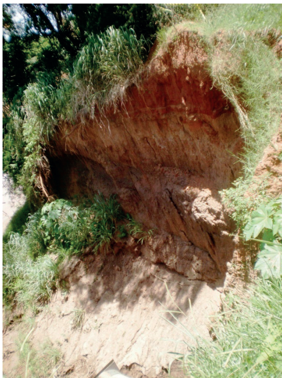
Figura 4: Feição erosiva acarretado pela descarga de água