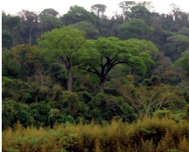
Figura 3: Área de Preservação Permanente do assentamento Che Guevara

Em alguns locais, como no assentamento Che Guevara, a APP (Figura 14) está preservada, ou seja, a vegetação é natural, com a presença de Embira ( Duguetialanceolata ), Aroeira ( Schinusterebinthifolius ) Embaúba ( CecropiapachystachyaTrec ) e Samambaia ( Aspleniumgastonis ) segundo Blum (2008).