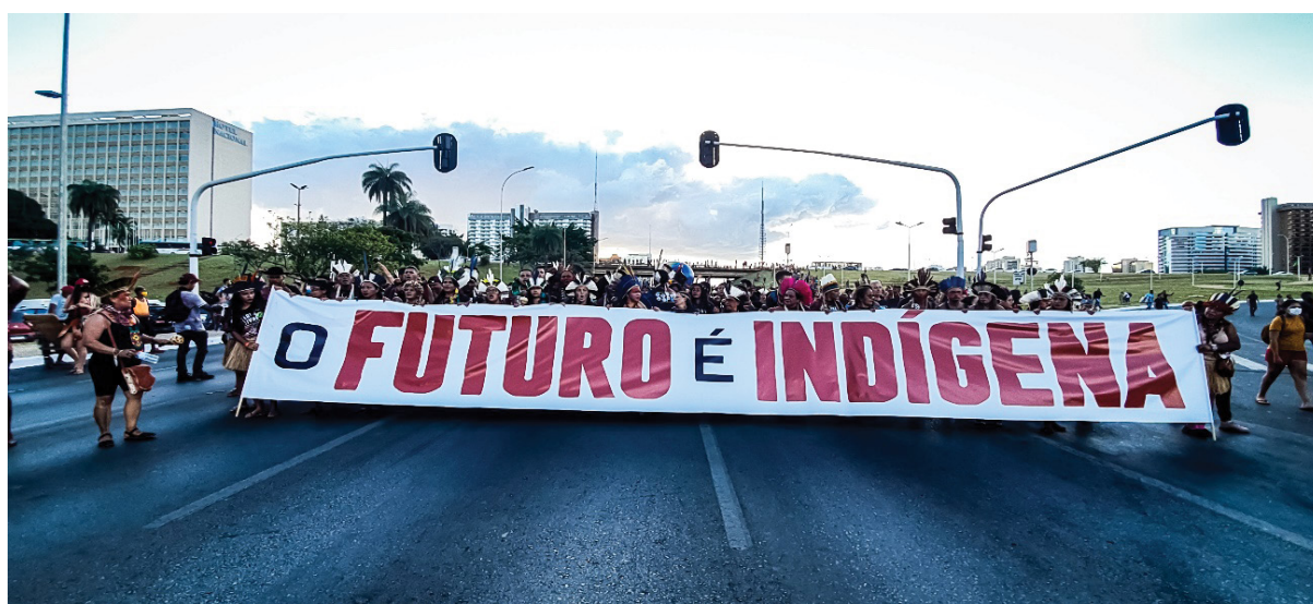
Figura 17 – Faixas politizadas sobre o devir indígena. Trabalho de campo, abril de 2022.