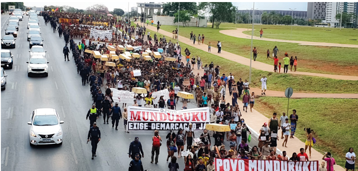
Figura 7 – Faixas, bandeiras e cartazes dos blocos da marcha, no ATL. Trabalho de campo, abril de 2022.