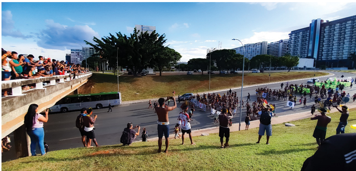
Figura 21 – Registro dos cidadãos sobre a marcha. Trabalho de campo, abril de 2022.

território e da constituição do lugar. De uma vez por todas, deve ser assimilado e difundido que o território é a base da existência de todos e todas, é abrigo coletivo e não exclusivo; e que o lugar envolve os processos de produção do cotidiano, de cima para baixo (comandado pelo tempo do mundo) e de baixo para cima (feito pelo tempo da vizinhança, da contiguidade e das solidariedades), cujo fundamento não é técnico, mas histórico, não é pragmático, mas tem uma grande parcela de emoção (Santos, 2000; Santos et al., 2001; Silveira, 2008; Souza, 2019). Sem essa clareza, não pode haver apoio à estética de esperança revolucionária reproduzida pelo ATL.