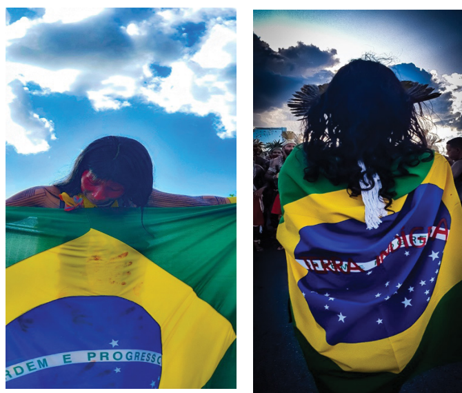
Figura 9 – Pavilhão Nacional, no ATL. Trabalho de campo, abril de 2022.

As marchas foram diversas e contaram com algumas intervenções mais complexas em sua parte interna. Dramas chamaram a atenção por buscar evidenciar a realidade dos impactos nos territórios indígenas e sua perda para o capital de forma autorizada ou induzida pelo Estado. A manifestação do dia 11 de abril ocorreu em parceria com o Green Peace e uma ação em frente ao Ministério de Minas e Energia culminou na representação do empilhamento de barras de ouro e o despejo de centenas de litros de argila