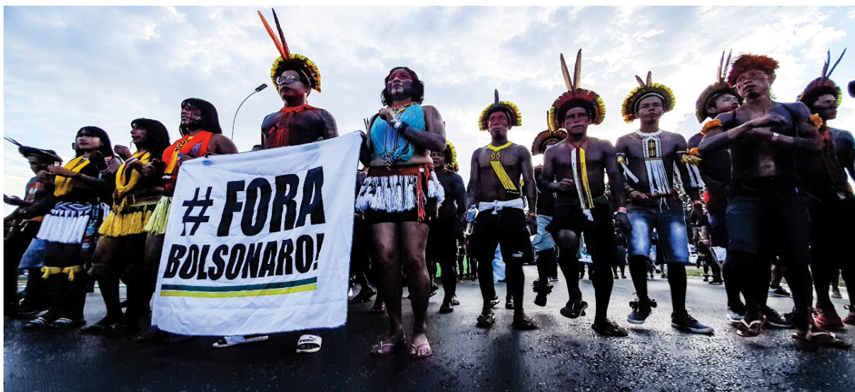
Figura 13 – Bandeira contra Jair Bolsonaro. Trabalho de campo, abril de 2022.