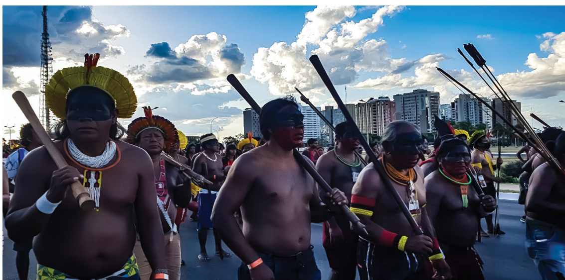
Figura 24 – Bordunas, arcos e flechas demonstradas nas marchas em canto. Trabalho de campo, abril de 2022.