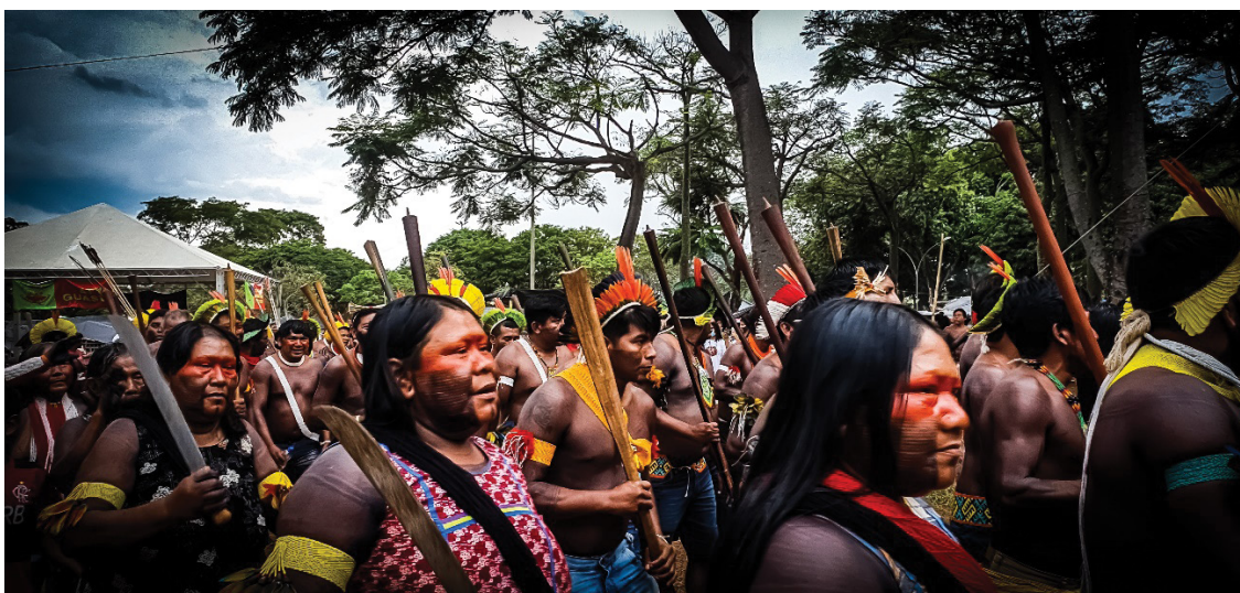
Figura 23 – Expressões do patrimônio-territorial, marcha, cantos e bordunas. Trabalho de campo, abril de 2022.

No dia 6 de abril, por exemplo, a instrução dada pela equipe de segurança e ecoada pelo caminhão de som orientou que arcos, flexas, bordunas e outros itens não seriam permitidos e deveriam ser deixados, especialmente, num ato cuja densa presença repressiva testemunhou o modo policialesco como o Estado e o Governo tratam a questão indígena (figura 23, 24 e 25). Além de testemunhar um complexo sistema de organização baseado em comissões de apoio à manifestação (segurança, saúde, logística, comunicação etc.), também, assim como nas falas desde o caminhão, evidenciou a existência de um planejamento em diálogo com outras instituições, uma vez que mais tarde a polícia militar revistou todos os participantes do ato em um check-point próximo aos Ministérios.