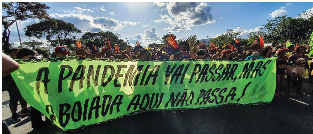
Figura 27 – Faixa crítica sobre a conjuntura ambiental brasileira durante a pandemia. Trabalho de campo, abril de 2022.

A intencionalidade dos usos monopolistas do território travestida de “apropriação da natureza” se confronta com o presente e compromete o futuro dos utopismos singularista, existencialista e patrimônio-territorial; a “natureza” é extensão dos corpos e mentes indígenas, indissociáveis de seus territórios ou da própria vida. Assim, o uso indígena do território indígena corresponde à dialética da vida total (e totalizante), supera a dicotomia território/terra, sujeito/território, sociedade/natureza que o Estado-mercado, estrategicamente, tende a vociferar. O território usado e o espaço geográfico recuperam essas unidades dialéticas e a Geografia não deve vacilar, metodologicamente, nessa interpretação.