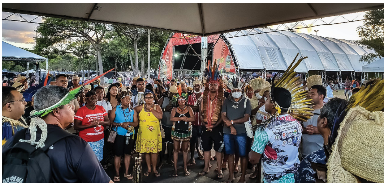
Figura 2 – Reuniões indígenas regionais e simultâneas no ATL. Trabalho de campo, abril de 2022.

Embora tais temas tenham ocupado a maior parte das manhãs e tardes na tenda central, o evento trouxe reuniões de articulações regionais em outras tendas (figura 2), bem como atividades pertinentes a campanhas indígenas, reuniões de diálogo e negociação com representantes do legislativo, executivo e judiciário em todo o evento. A análise de conjuntura foi permanente, se refazendo e se complexificando à medida em que o ATL e seus debates se qualificavam. A presença e resistência dos utopismos patrimoniais se manifestaram também nos rituais simultâneos (Jurema, Rapé, curas etc.), cantos e danças que se espalhavam pelo acampamento nas tardes e noites. Tornaram-se espaços de socialização onde os utopismos patrimoniais singularista, existencialista e patrimônio-territorial convergiram-divergiram e se retroalimentaram. “El patrimonio-territorial (...) contribuye a la duración espacial y el empoderamiento de grupos subalternizados en la duradera colonialidad, en el multipolar, multifacético, transescalar y transformado colonialismo” (Costa, 2021, p. 124).