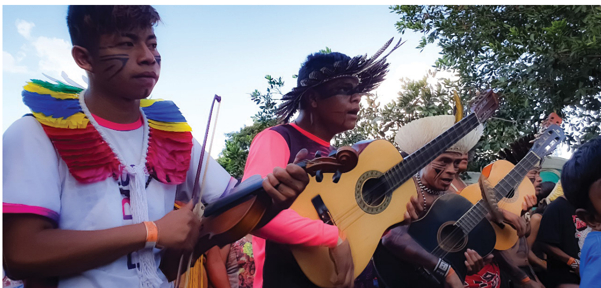
Figura 15 – Cantos e instrumentos musicais utilizados; mescla de saberes, culturas e expressões. / Trabalho de campo, abril de 2022.

Passos sincronizados, performados por corpos de diferentes gêneros e idades tremiam o chão sob o ritmo de uma marcha demonstrativa de potência e pelo confronto político sem beligerância. Em grupos organizados em forma de blocos com filas e linhas, quase sempre simétricas ou sob o aspecto de longas fileiras que se envolviam formando caracóis, serpentes e depois se desenrolavam, os povos indígenas eram convocados a adentrarem a tenda central para performar, cultuar, compartilhar e vibrar suas singularidades (valores ancestrais) e universalidades (a do próprio território como ente de direito coletivo e não exclusivo). O ATL, uma vez mais e consequente do empreendimento histórico indígena pela sobrevivência e defesa de sua razão , demarcou uma estética de esperança revolucionária contra o domínio colonial transposto e ressignificado, que passa a ser o conteúdo do “novo” imperial ou neoliberal.