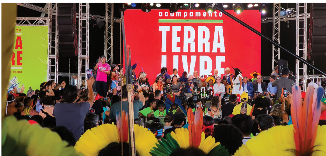
Figura 3 – Visita de Lula ao ATL. A esperança e novos utopismos. Trabalho de campo, abril de 2022.

O território usado defendido e argumentado em uma manifestação que se sustenta pela força de utopismos patrimoniais indígenas é a “expressão mais concreta da nação”, segundo Santos (2000), Santos et al. (2001), Silveira (2008) e Souza (Souza, 2019). A defesa aos usos indígenas do território requer uma visão unificada dos diferentes problemas desses povos, que se reproduzem por decisões legislativas-mercantis do Estado-mercado; seu amparo exige um vigoroso exercício de totalização, pois o território usado, sinônimos de espaço geográfico, também é a totalidade em movimento, que não opera nas ideias parciais ou não dialéticas de exclusão e segregação. O impedimento ao uso indígena do território é mais uso globalizado-tecnificado do território e, simultaneamente, mais luta pelo direito dos povos, como se vê pelo ATL e pelo crescimento do agronegócio no Brasil.