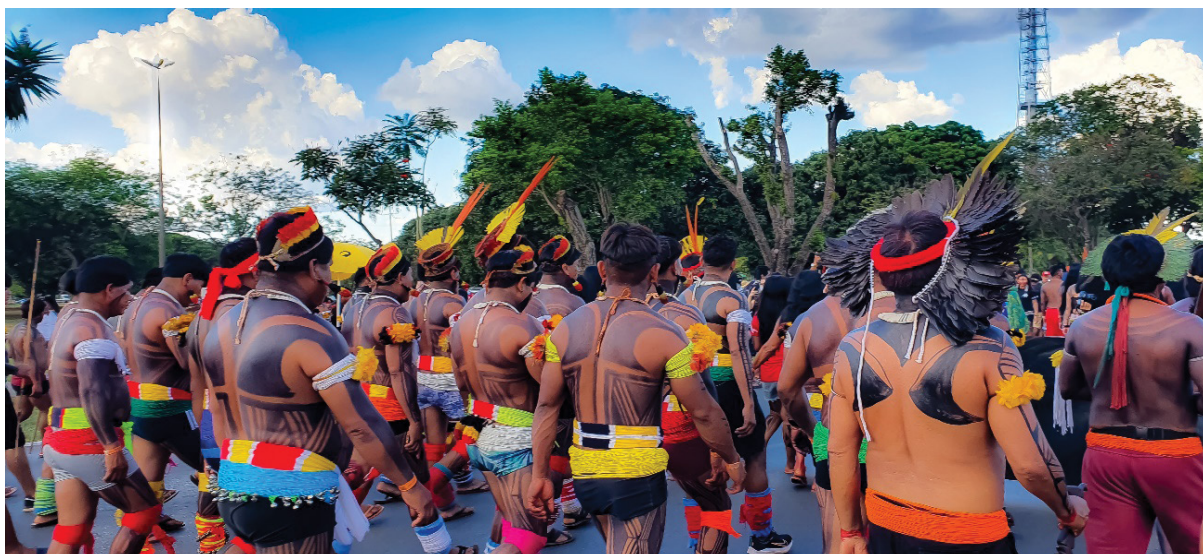
Figura 16 – Pinturas corporais com elementos dos respectivos territórios. Trabalho de campo, abril de 2022.

19 e 20), como: “Fora Bolsonaro”; “Ele não”; “Genocida”; “Demarcação já” etc.