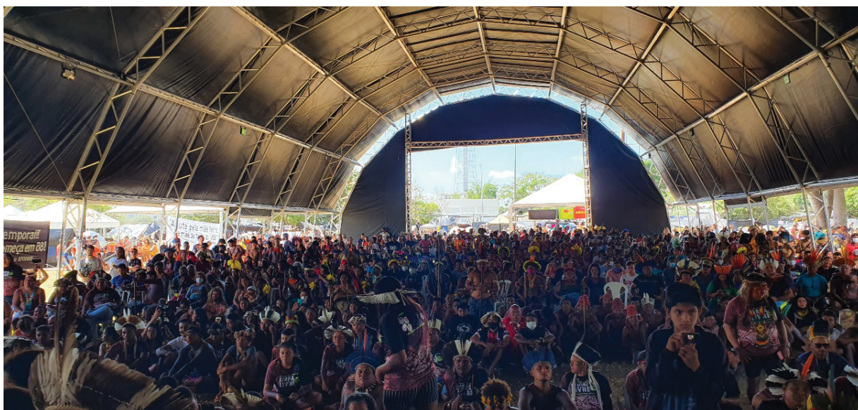
Figura 1 – Uma das plenárias do Acampamento Terra Livre. Trabalho de campo, abril de 2022.

Realizado entre os dias 4 e 14 de abril de 2022, o ATL contou com uma programação que abrigou uma pauta qualificadora de um amplo debate indígena, de aprofundamento de questões técnicas, denúncias e estratégias tomadas por diferentes povos, bem como o estabelecimento de agendas com aliados e novas parcerias. Iniciando com a acolhida, apresentação e reunião das delegações locais, no dia 5 de abril, o acampamento introduziu uma extensa agenda de rituais, marchas e debates, com a pauta: