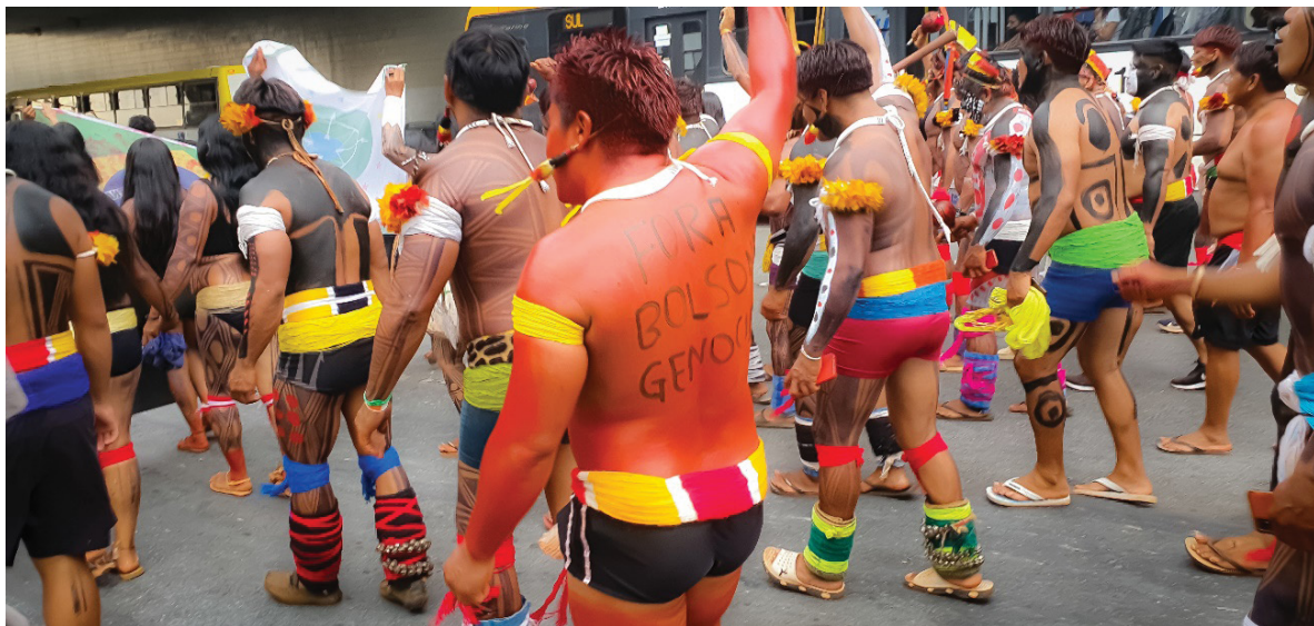
Figura 18 – Pinturas corporais e frases críticas a Bolsonaro e seu Governo. Trabalho de campo, abril de 2022.