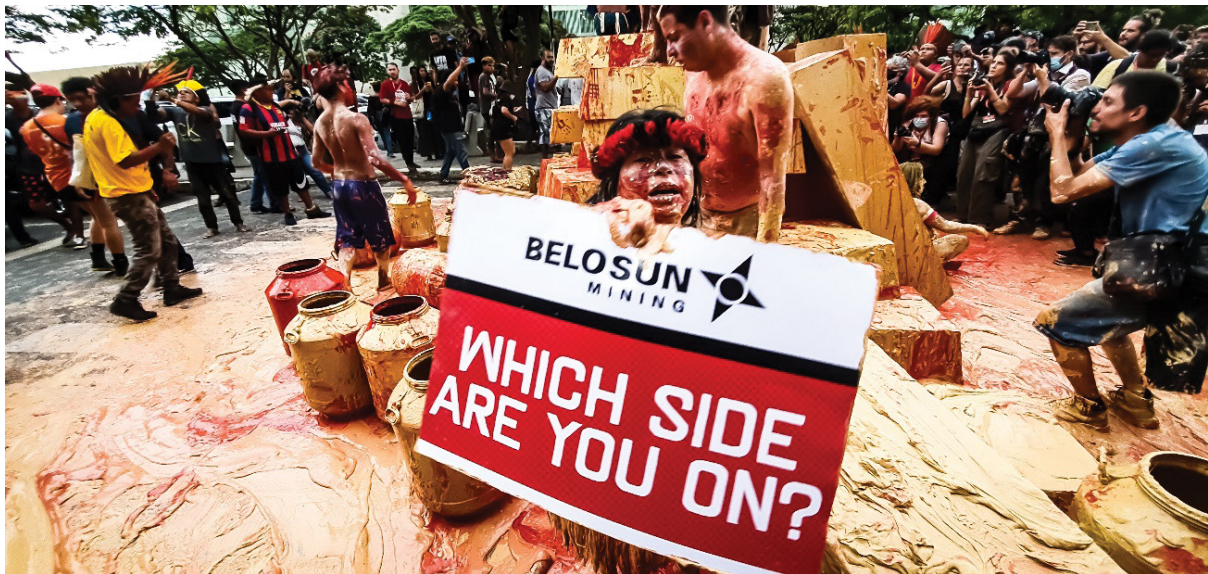
Figura 12 – Drama representado em frente ao Ministério de Minas e Energia. Trabalho de campo, abril de 2022.

Frases em inglês foram utilizadas em alguns cartazes, para potencializar a capacidade escalar de comunicação internacional dos dramas indígenas, tal como “ Which side are you on ” (De que lado você está) citando a mineradora Belo Sun (figura 12); além de fotos e montagens expostas em cartazes, corpos pintados contra o genocídio e criticando o presidente (figura 13), bandeiras manchadas com urucum vermelho para representar sangue e bonecos do Bolsonaro amarrado (figura 14); canções e torés animaram e, às vezes, se somaram entoando o canto uníssono “eu quero o Bolsonaro amarrado no cipó”. O ATL é um sítio constitutivo de uma fronteira para a tomada de consciência coletiva sobre a “diferença colonial” que se perpetua. Parafraseando Catalina León Pesantez, podemos dizer que o ATL é evento de mobilização que gera o ubicarse en la intersección del “Uno” y del “Outro” ; permite ao (des)classificado estar dentro, mas também estar fora, para manter a distância crítica. “La frontera hace que la conciencia del subalternizado se mueva en un horizonte pluritópico , porque ella se constituye em relación com la conciencia del amo” (León Pesantez, 2005, p 125).