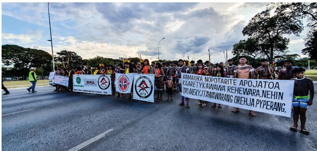
Figura 8 – Faixas, bandeiras e cartazes dos blocos da marcha, no ATL. Trabalho de campo, abril de 2022.