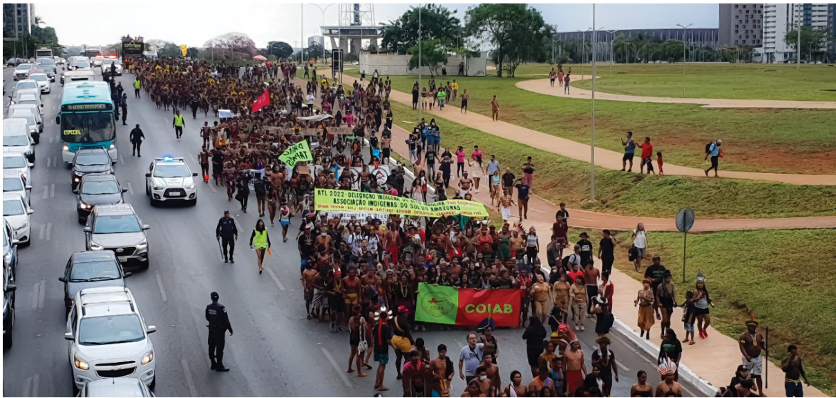
Figura 6 – Faixas, bandeiras e cartazes dos blocos da marcha, no ATL. Trabalho de campo, abril de 2022.