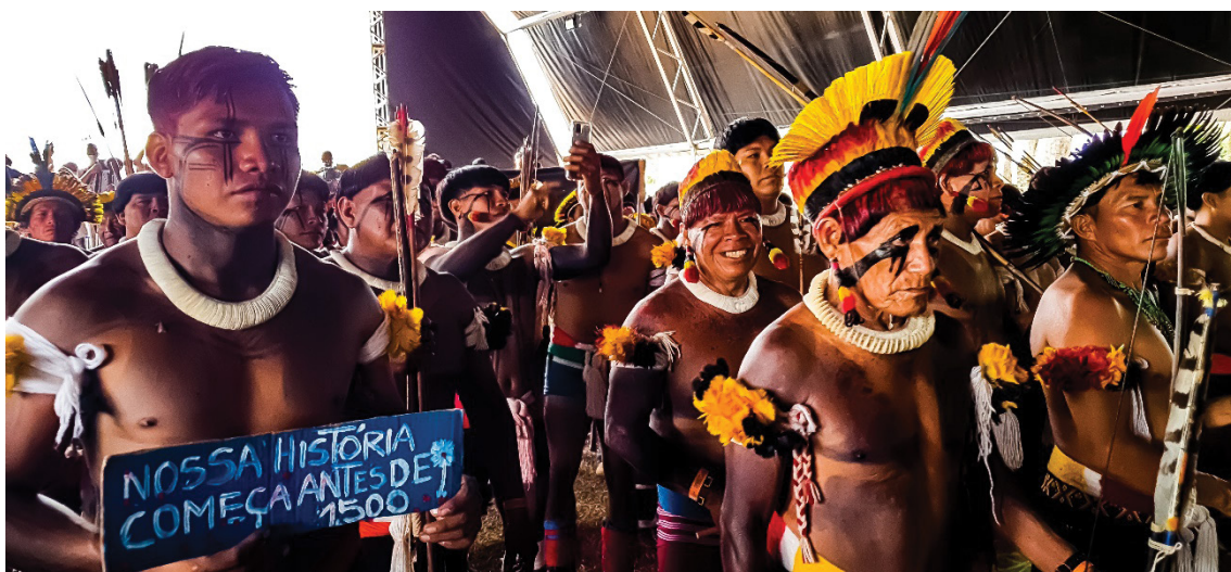
Figura 4 – Organização para a marcha composta por diferentes gerações e povos indígenas, no ATL. Trabalho de campo, abril de 2022.

bandeiras, cartazes, palavras de ordem e músicas. O pavilhão nacional evidenciou-se como objeto de disputa, crítica e identificação nas mãos de povos que sobrescreveram “ Terra Indígena ” na faixa que leva a consigna “ Ordem e Progresso ”, bem como “ Essa bandeira é nossa ” (figura 9). Estas manifestações reforçam o entendimento de que o uso do território se constitui em uma categoria social de análise explicativa da forma como a sociedade se organiza (Souza, 2019), dialetizando objetos geográficos tecnicizados na razão de interesses público-capitalistas hegemônicos (hidroelétricas, projetos de lei, mineração etc.) com a racionalidade da luta popular pela existência (direito à terra e ao território usado). Na perspectiva miltoniana, os usos do território denunciam as dinâmicas dos lugares que, constituídos por aconteceres solidários, escancaram interesses específicos e contraditórios.