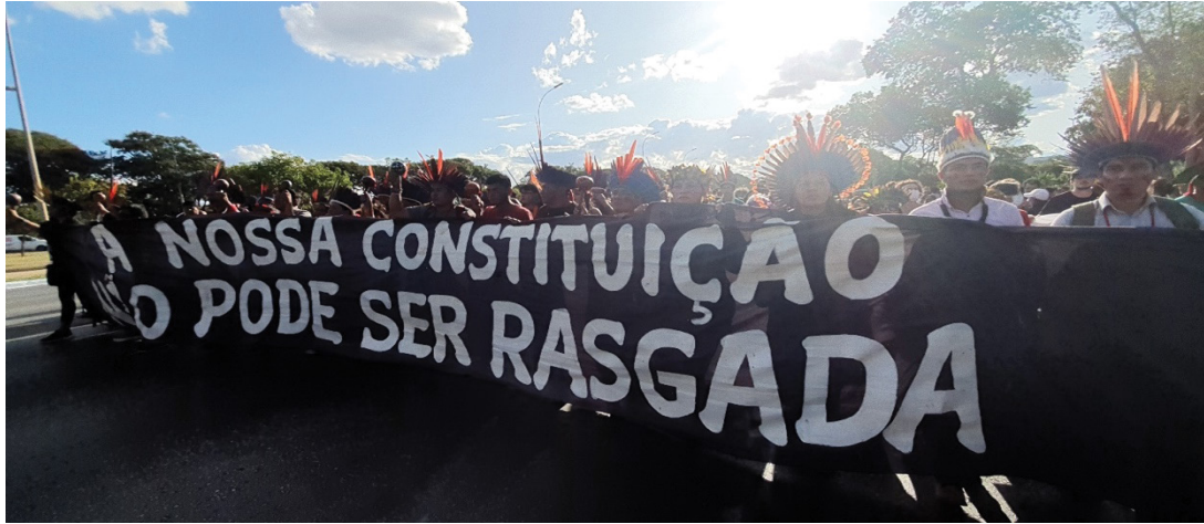
Figura 26 – Faixa em defesa de direitos constitucionais. Trabalho de campo, abril de 2022.