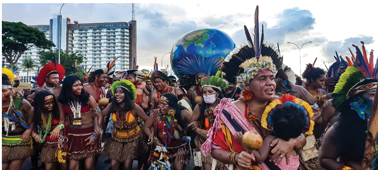
Figura 5 – Protagonismo das mulheres em alguns dos blocos em marcha. Trabalho de campo, abril de 2022.