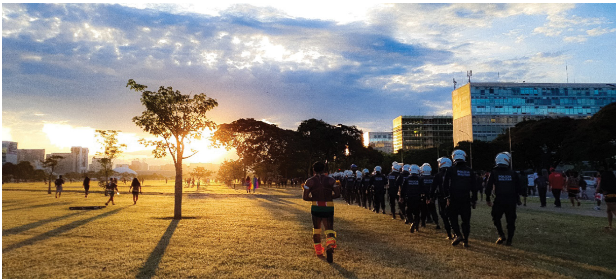
Figura 25 – Presença policial acompanhando as marchas. Trabalho de campo, abril de 2022.

Ao deixar os tacapes (bordunas), arcos e flechas, ainda se valiam dos cachimbos, ornamentos e as pinturas corporais feitas com jenipapo, urucum e carvão, para marcar a identificação das famílias e povos, representando não somente simbolismos geracionais, mas também suas históricas formas de marcar seus corpos para a guerra, em defesa do direito ao uso de seus territórios. Todos esses elementos concretam o utopismo patrimônio-territorial no resguardo da vida.