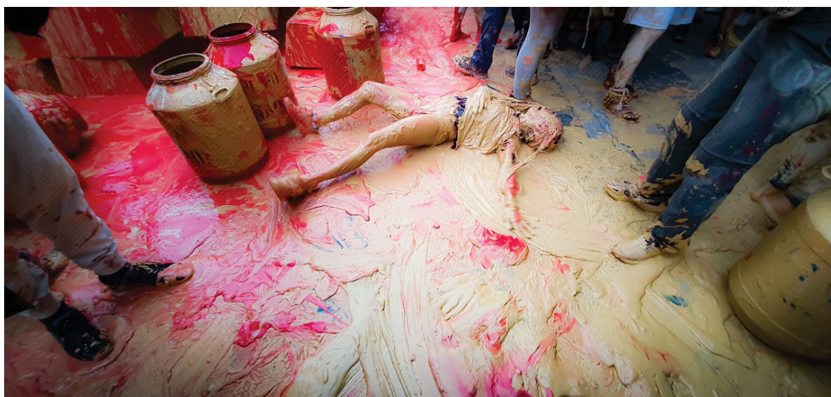
Figura 11 – Drama representado em frente ao Ministério de Minas e Energia. Trabalho de campo, abril de 2022.

Entender la decolonialidad originaria, desde América Latina, demanda un ejercicio ontológico sobre el “ser” y la “duración” indígena en el continente, pues ella irrumpe en el nativo como praxis estética en el proceso colonizador; significa toda práctica, expresión, objeto y conocimiento revolucionarios, que demarcaron resistencia u objeción, desde dentro, a las violencias coloniales, aunque para eso se valgan de mecanismos de la conquista, como la iglesia, el barroquismo y los mitos. (Costa & Moncada, 2021, p. 07)