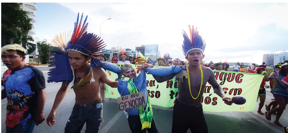
Figura 14 – Representação crítica a Jair Bolsonaro, amarrado no cipó. Trabalho de campo, abril de 2022.

A agitação atravessou o evento por inteiro, mas o aquecimento para a manifestação de 6 de abril destacou-se pela abordagem vibrante que, simultaneamente, realçou as singularidades dos povos e territórios e a “universalidade eurocêntrica do condicionamento territorial” (Costa & Moncada, 2021). Além de coordenadas gerais sobre a organização do ato, a concepção de marcha figurou-se numa ação