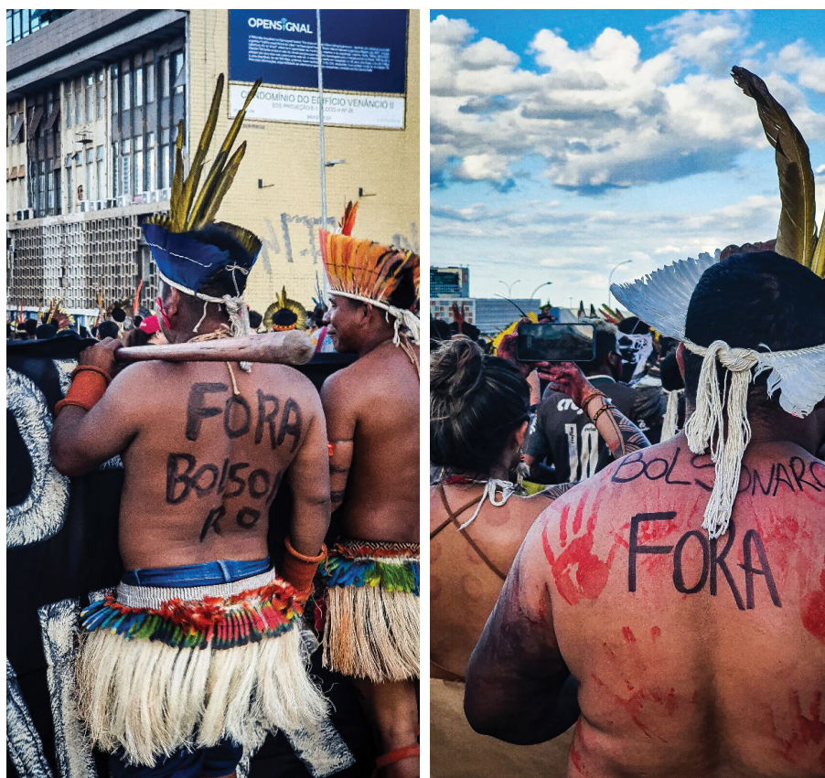
Figura 19 – Frases críticas sobrescritas ao corpo, contra Bolsonaro. Trabalho de campo, abril de 2022.