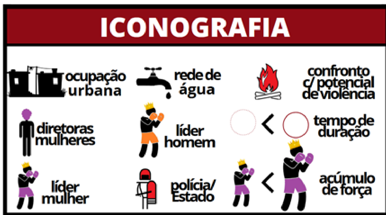
Figura 1 – Iconografia da Cartografia da Luta pelo Lugar da Cidade Locomotiva (Ribeirão Preto/SP) Elaboração: Pela pesquisadora (2020)

Esses ícones alteram de tamanho quando há mudança, ainda que momentânea, do acúmulo de força de cada um dos/as agentes. Os tamanhos de cada símbolo deve ser comparado entre os/as agentes que compõem o mesmo evento e em relação ao conjunto de eventos espacializados. Dentre os ícones escolhidos para simbolizar as materialidades (ocupação urbana e rede de distribuição de água), apenas as ocupações urbanas apresentam alteração de tamanho com o intuito de auxiliar na compreensão sobre o acúmulo de força adquirido pelo lugar. Enquanto o ícone indicando confronto, com potencial de violência, aponta um componente importante do evento, posto que, a eminência de violência deve ser considerada para a interpretação das forças em disputa. Nomeamos como confrontos, e não como conflitos, porque estes são essenciais à vida de relações por movê-las, enquanto os confrontos se referem à iminência do uso de violência física que não é necessária para fomentar mudanças ainda que algumas vezes o faça.