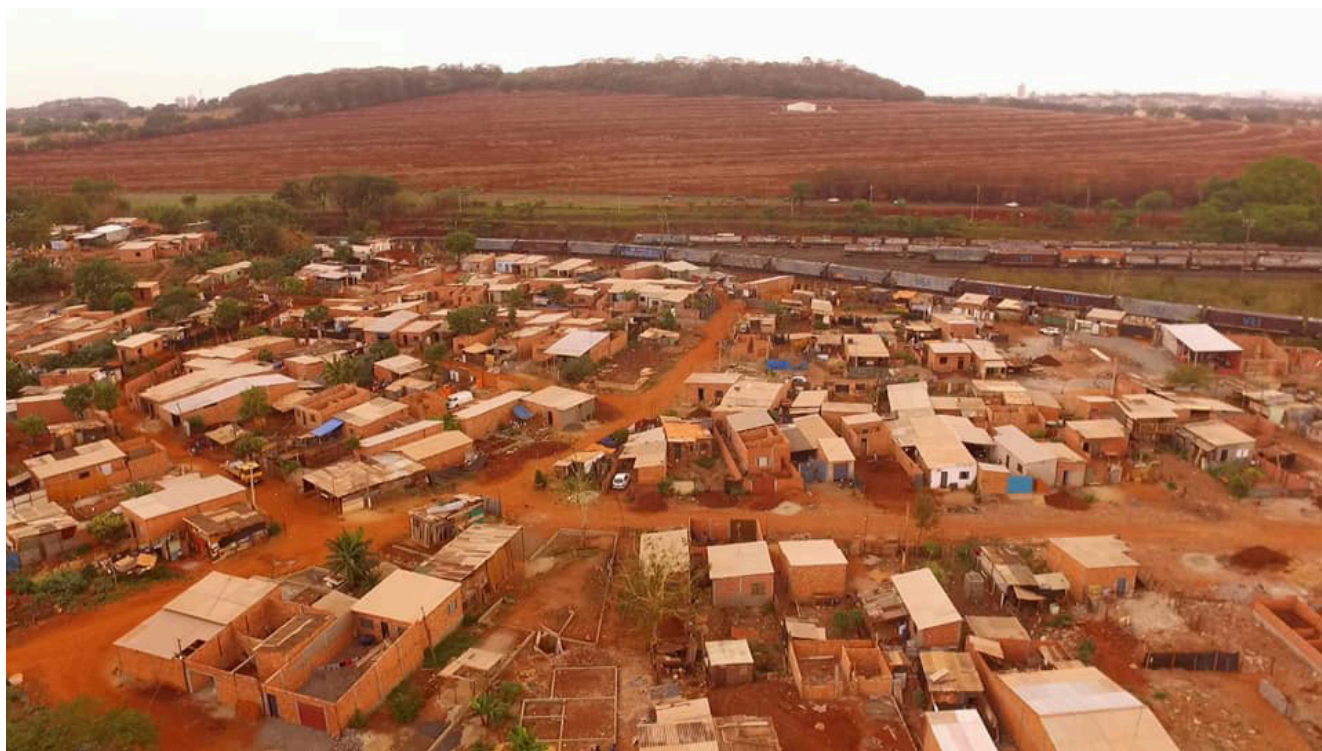
Figura 2 – Comunidade Cidade Locomotiva (Ribeirão Preto/SP)

A ocupação possui esse nome, pois ela se instalou num terreno urbano, vazio e sem uso, majoritariamente de propriedade da União, às margens da Ferrovia Central Atlântica (FCA), atualmente sob concessão da empresa de logística VLI - instituindo-se como importante vetor de modernização do lugar -, e havia no local dezenas de vagões de trem abandonados. Parte deles foram transformados em entulhos para o aterro da área e outra parte, ao redor de dez vagões, foram transformados em moradias e são utilizados como tal, principalmente, pelas lideranças da comunidade. É possível visualizá-la na figura 2.