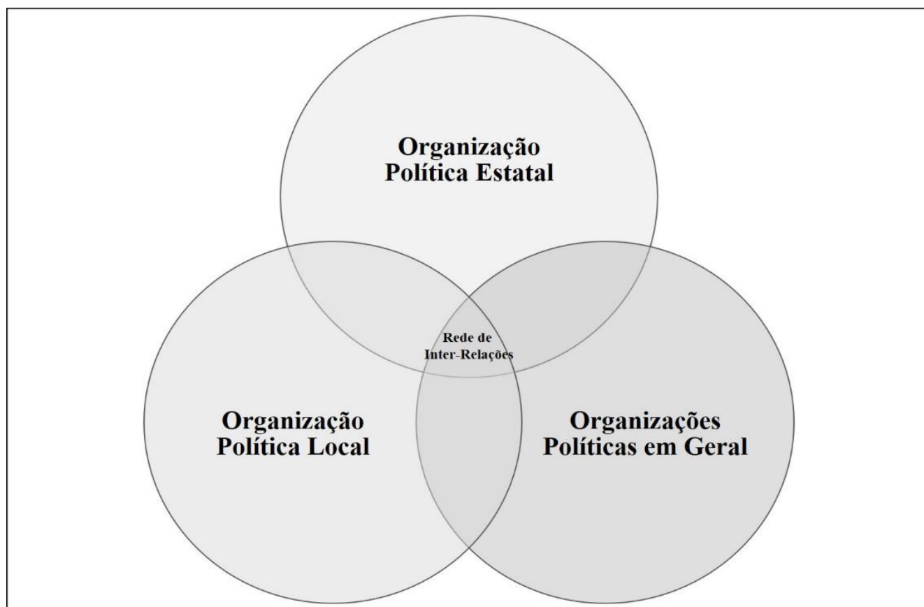
Figura 03. Esferas de organização política para interpretação dos ativismos. Elaboração: Lima e Cigolini (2019).

Igualmente, destacamos que, ao considerar as relações de poder na produção do espaço, abre-se um grande leque de possibilidades, escalas de análise e sujeitos. Portanto, faz-se necessário delimitar quais relações de poder se busca sendo elas as relações que envolvem mais diretamente as resistências populares. Com base neste ponto, e de forma a não criar níveis ou hierarquias na rede de inter-relações existentes, propõe-se interpretar a organização política da Associação de Moradores 23 de Agosto e da Ocupação Dona Cida a partir de três esferas, sendo elas: (1) a esfera de organização política estatal, (2) a esfera de organização política local, e, (3) a esfera de organizações políticas em geral. Deste modo, chama-se atenção para as redes de inter-relações que ocorrem coetaneamente, por vezes em conflito, entre uma esfera e outra, assim como entre as três, como representado na Figura 03.