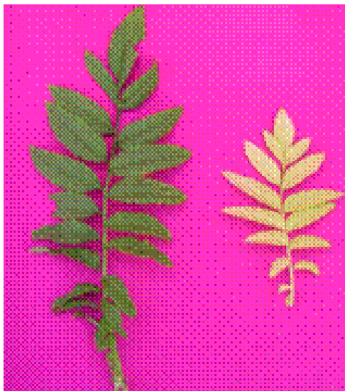
Figura 1. Folha Tratamento completo (esq.) e -N (dir.).

As plantas sob omissão de N, inicialmente, apresentaram porte reduzido e clorose generalizada, mais acentuada em folhas mais velhas (Figura 1).