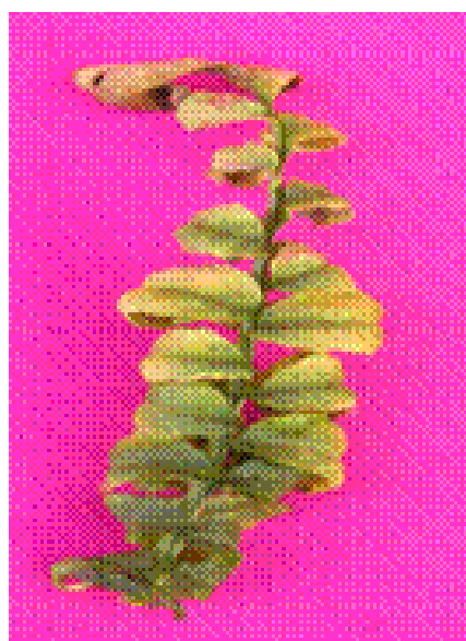
Figura 3. Aspecto da folha sob tratamento -K.

Com o aumento da intensidade dos sintomas as folhas se curvaram o que deu à planta aspecto de murcha (Figura 3).