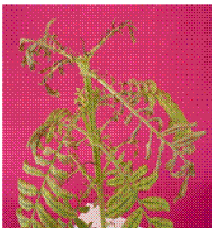
Figura 7. Aspecto geral das plantas do tratamento -Fe.

As plantas sob deficiência de Fe não floresceram durante o período experimental.