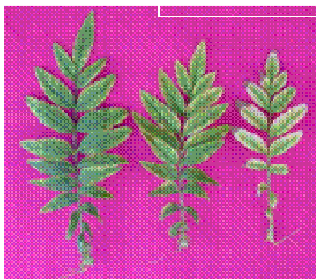
Figura 4. Folhas do tratamento -Ca à esquerda folha mais velha à direita folha nova

As raízes apresentaram necroses dos ápices, o que as deixou com aspecto de mais grossas, quando comparadas ao tratamento completo e volume visivelmente reduzido. A carência de Ca afeta particularmente os pontos de crescimento da raiz, causando o aparecimento de núcleos poliplóides, células binucleadas, núcleos constrictos e divisões amitóticas causando seu escurecimento e posterior morte da raiz, levando a paralisação do crescimento (Malavolta et al., 1997). As plantas deste tratamento não emitiram inflorescências. Arbos (1992) ao trabalhar com plantas de crisântemo observou sintomas semelhantes para a deficiência desse nutriente.