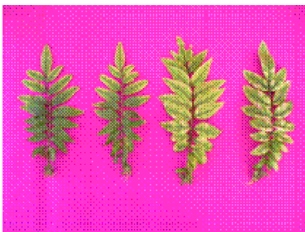
Figura 6. Folhas do tratamento -B à esquerda folha mais velha à direita folha nova.

Com o avanço dos sintomas, os folíolos tornaram-se pálidos, porém exibindo uma faixa de tecido não clorótico próximo às nervuras (Figura 6).