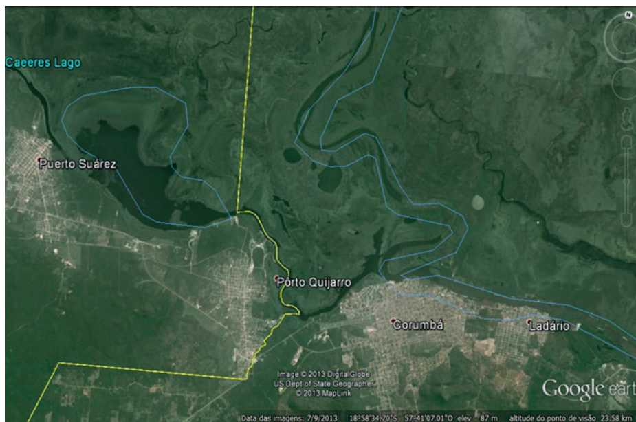
Figura 1 -Vista aérea de la región Corumbá-Puerto Quijarro. Disponible en: http://www.skyscrapercity.com/showthread.php?t=1661766

Resaltamos que, de los 17 alumnos matriculados en la sala de aula donde fueron recopilados los datos, 14 son hablantes de la lengua española en una escuela brasileña en que la lengua oficial es el portugués. La referida escuela está ubicada en una zona de contacto Brasil-Bolivia. Se trata de un contexto en que las lenguas portuguesa y española se mezclan, así como la cultura de los dos países transita libremente mostrándose, así, como una zona de contacto.