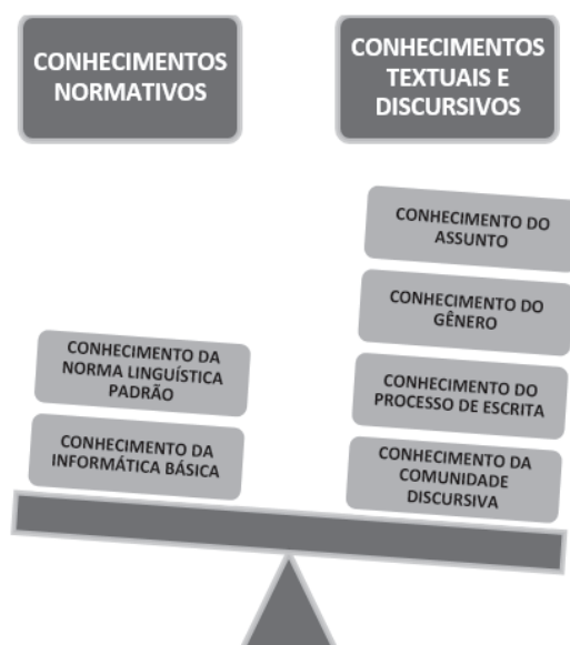
Figura: Conhecimentos normativos e conhecimentos textuais e discursivos

Em síntese, os conhecimentos relativos à norma linguística e aos recursos de editores de texto (informática básica), que auxiliariam na correção de aspectos da norma, não são devidamente aprendidos nos três primeiros períodos letivos do sujeito investigado, ao passo que os conhecimentos relativos ao domínio da textualidade e do discurso parecem ser os que se consolidam como aprendidos no período focalizado. Assim, à semelhança de uma balança, conforme demonstrado na figura a seguir, os conhecimentos do segundo tipo parecem pesar a favor da inserção do sujeito na esfera acadêmica.