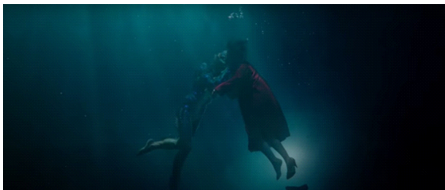
Figura 3: Cena final de A forma da Água .