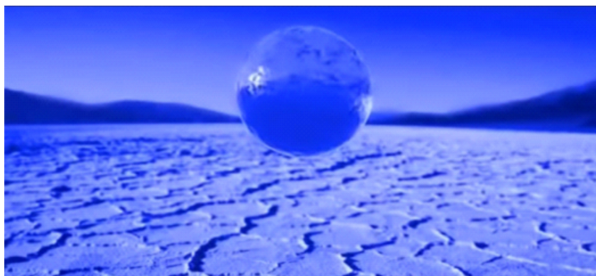
Figura 1: A escassez azul.