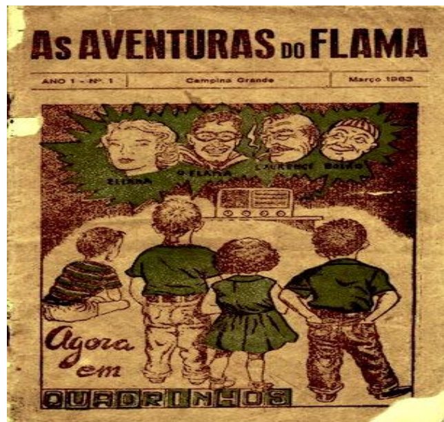
Figura 2 - Capa do primeiro número da Revista As Aventuras do Flama , 1963