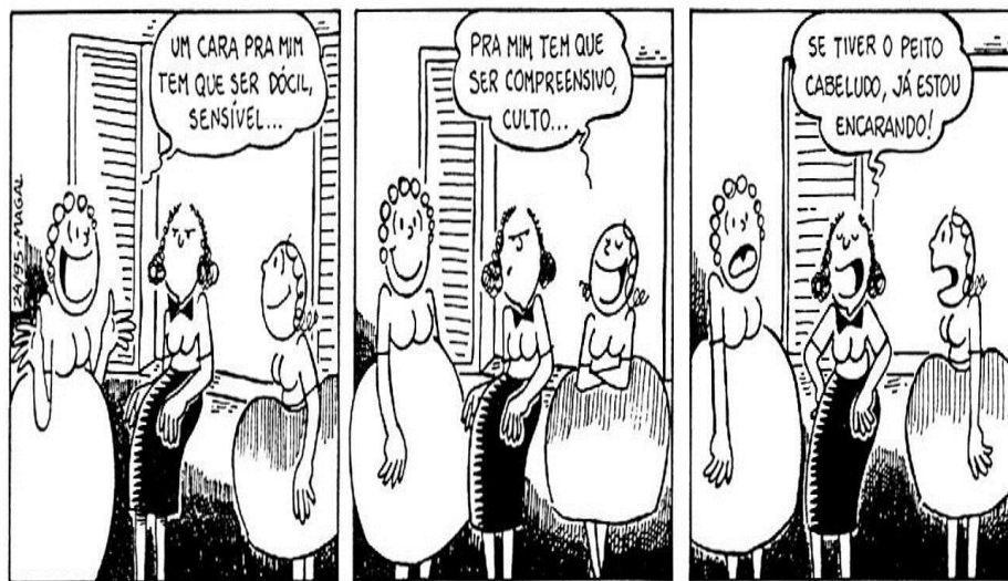
Figura 4 - Tira com a personagem Maria, de autoria de Henrique Magalhães