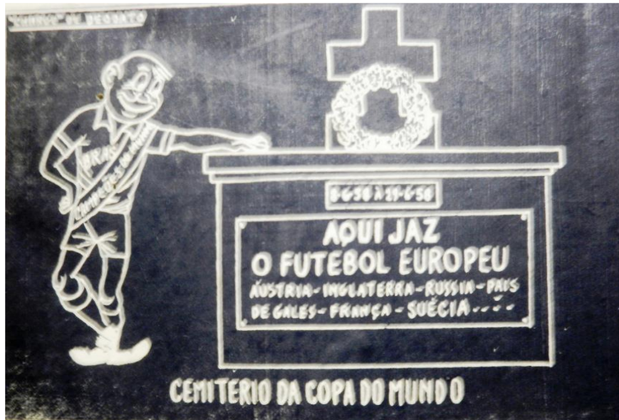
Figura 1 - A primeira charge de Deodato Borges, publicada no DB, em 1958