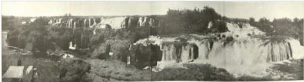
Imagem 01 – Salto de Urubupungá