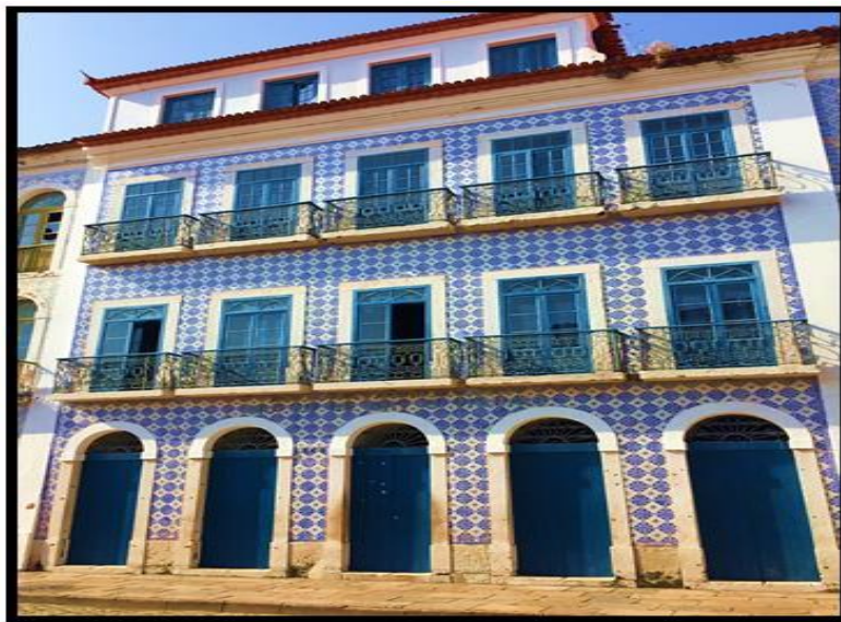
Figura 3 - Fachada de Casarão localizado na Rua Portugal com detalhes em azulejo português e mirante