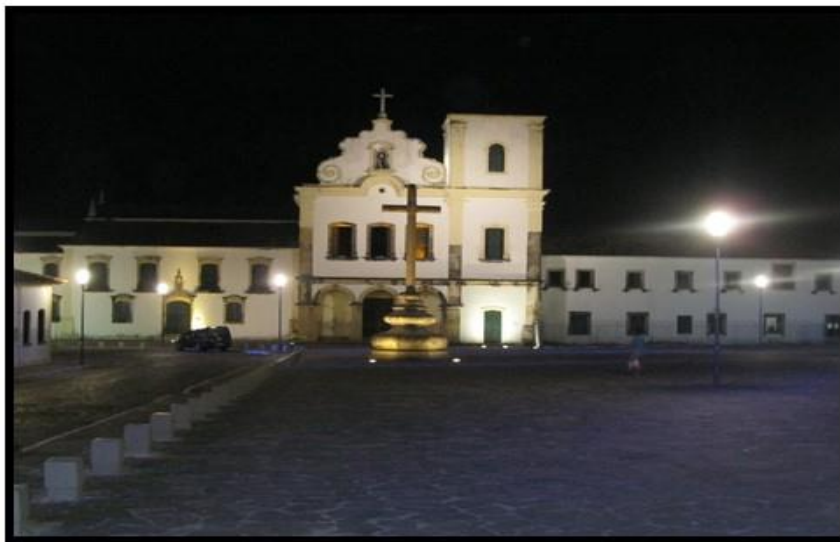
Figura 2 – Visão Noturna da Praça São Francisco com o Cruzeiro e Convento Franciscano

Há mais de 400 anos desde que foi construída a Praça São Francisco (Figura 2) e os prédios ao seu redor, se mantêm como a “joia do barroco sergipano”, modelo do Código Filipino de Construção (FALCONI, 2005). Por conta das novas gerações de usuários que surgem (entre moradores e visitantes), a praça continua se reinventando ao oferecer o seu espaço para as novas demandas. A Praça São Francisco é local de nostalgia para eventos que estão na memória de residentes do passado e nos moradores presentes no cenário atual da cidade.