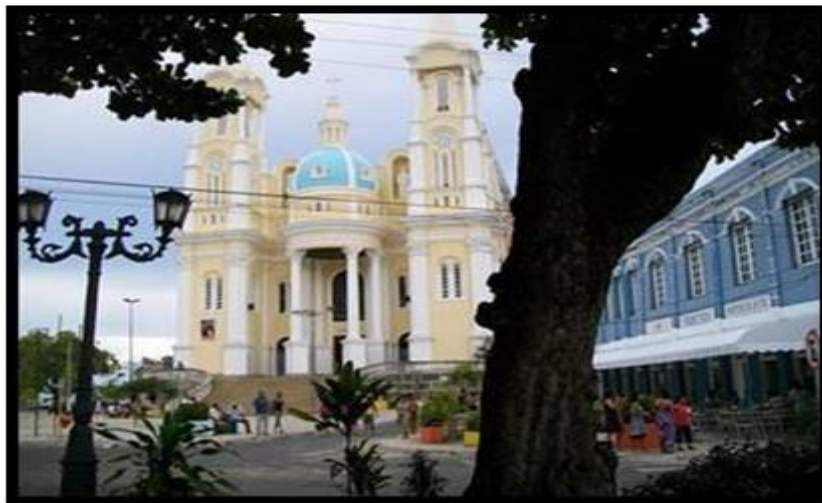
Figura 4 - Praça D. Eduardo, com o bar Vesúvio a esquerda e a Catedral de São Sebastião ao fundo. Ilhéus-BA