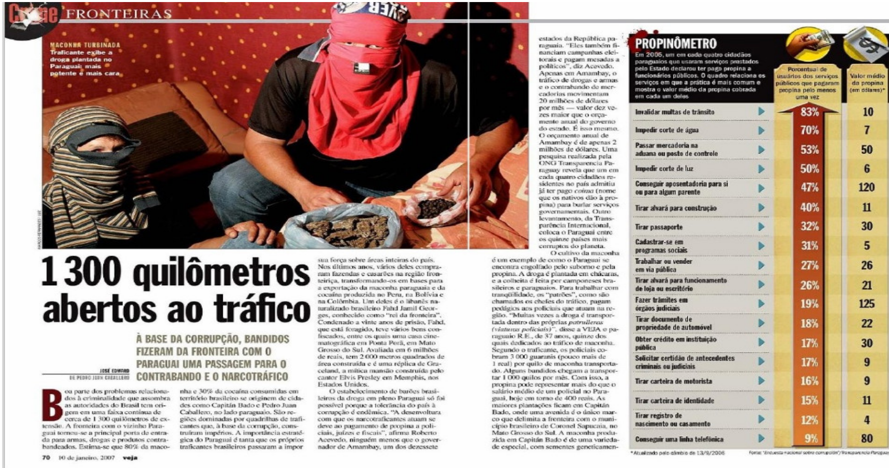
Figura 3 – “1.300 quilômetros abertos ao tráfico”. Ed. 1990. (10/1/2007)