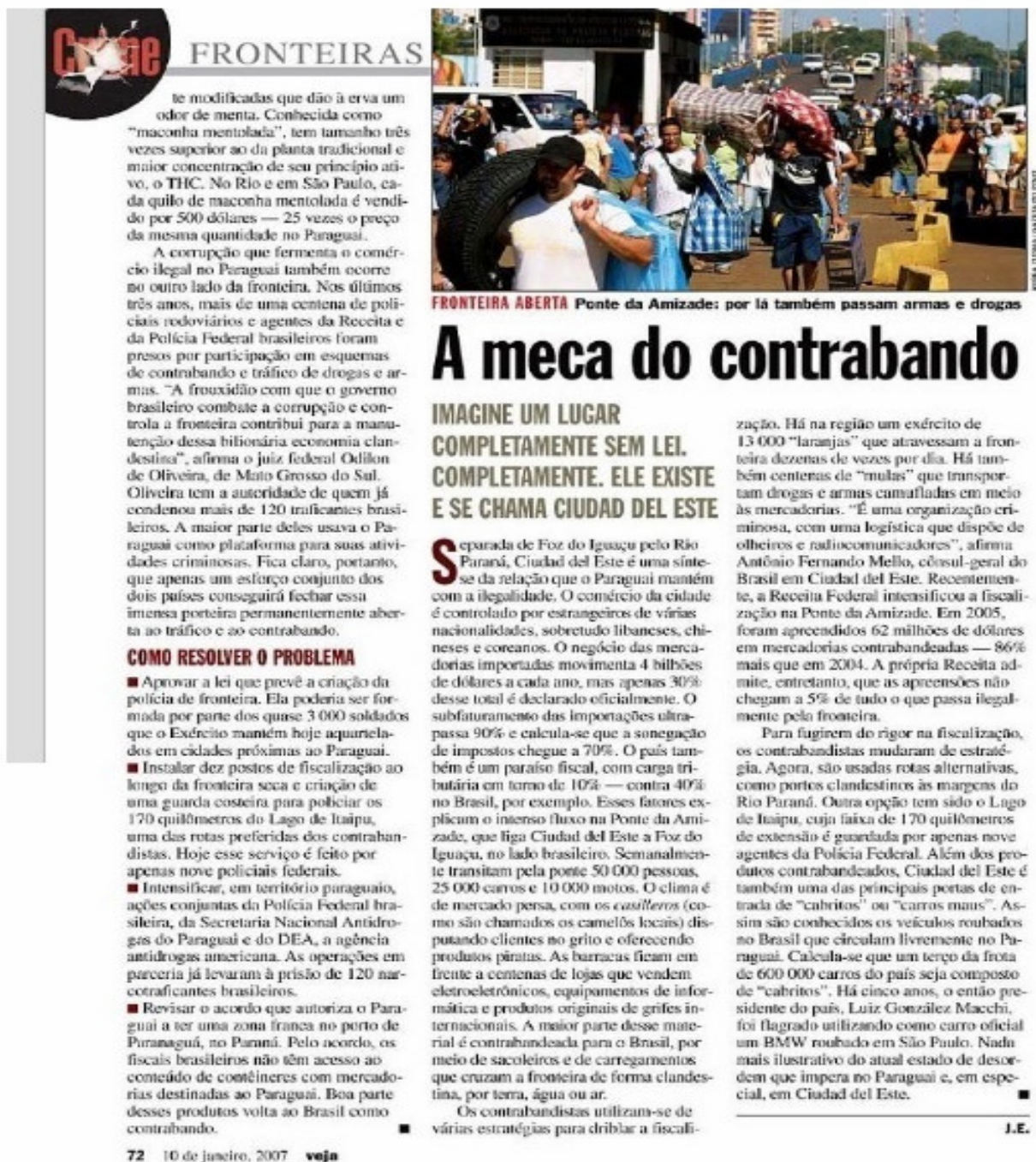
Figura 4 – “A meca do contrabando”. Ed. 1990 (10/1/2007)

Encerrando os textos que versam sobre o país guarani presentes no caderno especial está a reportagem “A meca do contrabando” (EDWARD, 2007a).