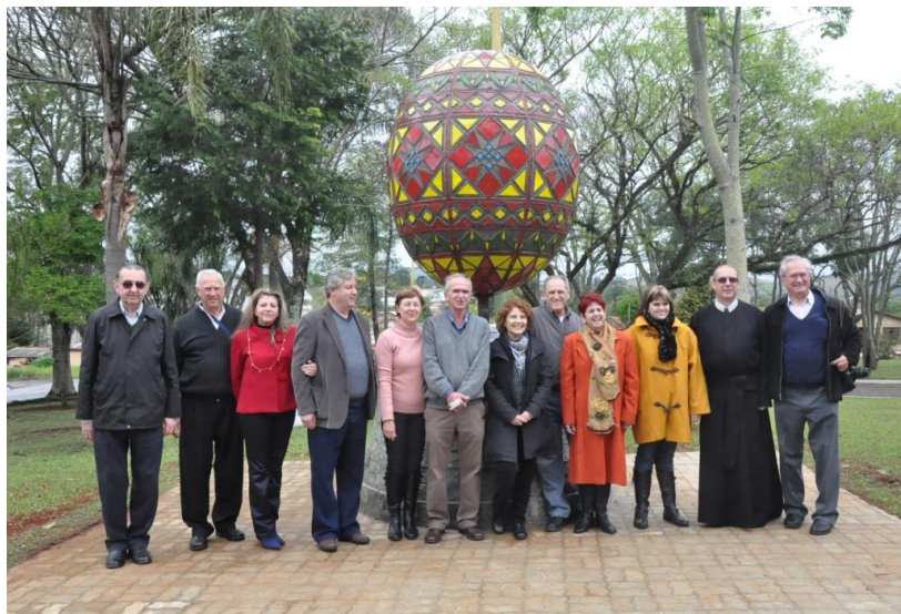
Figura 01 - Monumento à Pessanka Inaugurado em Ivaí